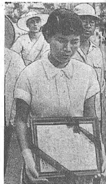
Япондо Хиросима-Токио гэгшэн рудаар эб найрамдалай түлөө километрын аяшлага хэгдөө шалгада хабаадагшадай Юсука, Киото болоч бусад городууд соогуур гарахадань хэдэн зуун архэтэд тэдэнтэй элжэ аяншалгада ябалсаа. Зураг аяшлагада хабаадагшан Мацико ма Хиросимада наһа бараһан хүнэй нэрэн бэшэтэй таблица ябана. Эда дүрбэн хүн атомна рабаа уламжалан үбшэлжэ, наһаха бараһан байна.

ДЖАКАРТА, августын 4. (ТАСС). Н. С. Хрущев Мао Цзэ-дун хоёрой уулзаһан тухай коммунистедэ Индонезийн хэблэл болон олонинтэ гол анхаралаа хандуулна. Коммунистегэй хүсэд текстэе гу, али тэгээн тухай мэдээсэлэе газетэнүүд томо гаршагуудтайгаар эли газарта толилохо зуураа, дээдэ зэргэтэнэй зүблөө түргэнөөр зарлаха тухай, Дунда болон Дүтын Зүүн зүгтэ оронуудһаа интегэвентүүдэй сэрэгүүдэе гаргаха тухай эрилтэ онсолон тэмдэглэнэ. Коммунисте хадаа американска болон англиска империалистуудта ехэ хүсэтэй уридалан хануулга болоно гэжэ «Хариан Ракьят» газетэ түрүү бэшгэ соогоо тэмдэглэһэн байна. «Хрущев Мао Цзэ-дун хоёрой уулзаһан тухай коммунисте дайн байлдаа зайсуулха, бүхэ дэхэй дээрэ эб найрамдал хангаха хэрэгтэ ехэ туһа нэмэри болоно. Өөһдөгөө хосорон халаха аюулай үмэнэ табиһыгаа урда тээ хэдэн олон дахин бодожо үзэхынь империалистуудыг энэ коммунисте баадхана гэшэ. Гэхэтэй хамта, коммунисте хадаа бидэнэй зэргые, бата бэхи эб найрамдалай түлөө тэмсэгшэдэй түгэлдэр зэргые нэгдүүлхэ зорилгоор эдбхи хэшээлээ хэдэн оло дахин арбадахыемнай баадхана» гэжэ «Хариан Ракьят» газетэ онсолон тэмдэглэбэ. Американска болон англиска империалистуудай хорото нааашалгануудые угаа ехэ һэргэ хэрхоор ажаглан хаража байхые газетэ уряална.