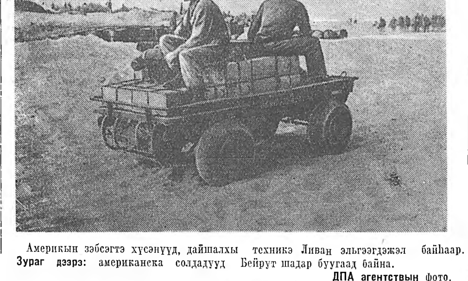
Америкийн зэбсэгтэ хүсэнууд, дайшалхы техникэ Ливан эльгээгдэжэл байһаар. Зураг дээр: американска солдадууд Бейрут шадар буугаа байна.