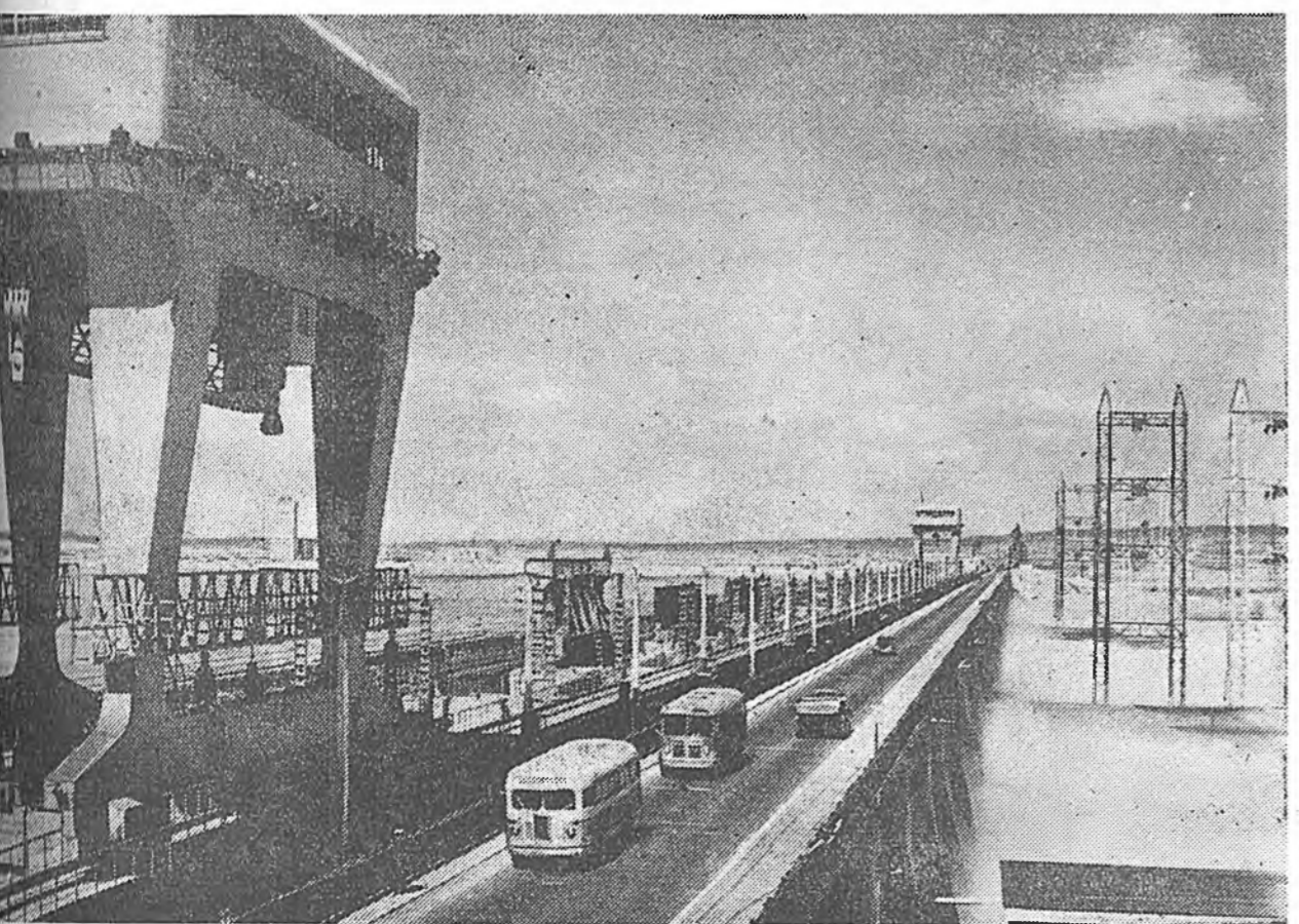
Куйбышевгидрострой. Куйбышевска гидроэлектростанци дээрүүр автобусууд ябадаг болоо. Зураг дээрэ: Куйбышевска гидроэлектростанци дээрүүр автобусууд гаража ябана.