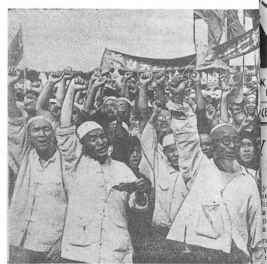
Пекин. Ливал болон Иордания американо-английска интервенциидэжэ байһыне 600 миллион тоото хитад арад угаа ехээр уур сухалаа хүрэн бидэ- лана. Зураг дээрэ: интервенцине буруушаанан демонстраци Сянпэ гүр- бөжө байна.

ДЕЛИ, августын 11. (ТАСС). Ин- дин парламентын зунай сесси мүн- өөдөр энде нээгдэбэ. Сесси 6 неде- ли соо үргэлжэлхэ юм. Зүбшэхэ зүйлдэнэ уласхоорондын байдал, ороной эдэе хоолой асуудал, Ин- дин хоёрдохи табанжэлэй түсэбэй ямараар дүүргэгдэжэ байһан тухай ороной түсэблэлгын комиссинн элидхэл болон бусад асуудалууд ороно.