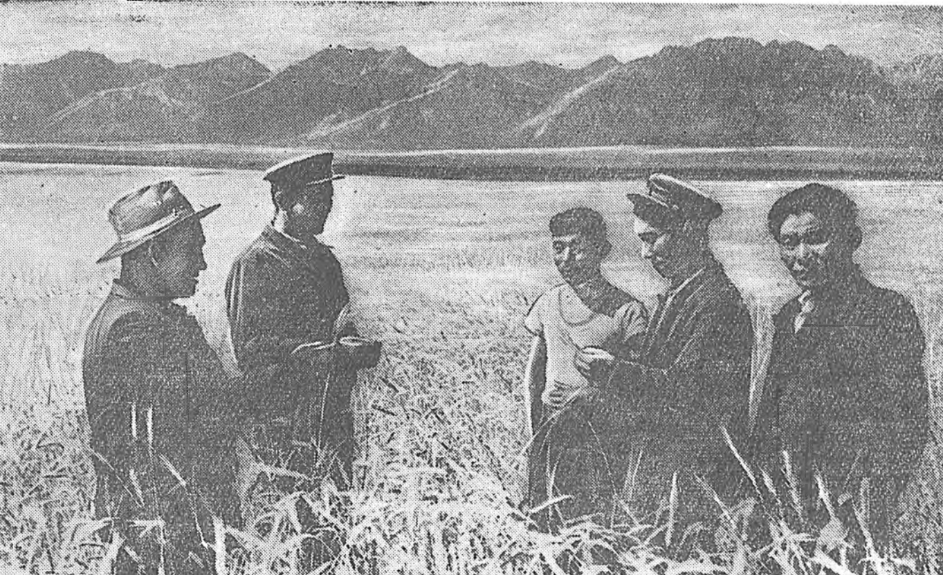
ЗУРАГ ДЭЭРЭ: Курумканай аймагай Карл Марксын нэрэмжэтэ колхозой 2-дох комплексно бри- гадын механизаторнууд таряанайнгаа эдээшэниие үзэжэ байна.

Лафетнэ жатка бүхэниие шимэ ехэ бүтээсэтэйгээр ашаглая!