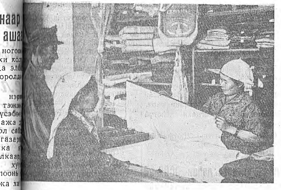
ЗУРАГ ДЭЭРЭ: Алтай тосхоной сельмаг соо хүн зон ходооо олон байдаг.

1958 оной июлин эхээр республикын культурын хүдэлмэрилэгшэдэй нэгэдэхэ съезд болоһон байна.