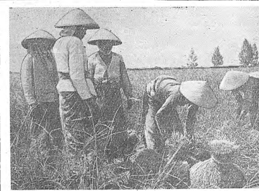
Индонези. Ява арал. Черибон городей шадар барайгар хуряагдажа байһан.

ПАРИЖ, августын 14. (ТАСС). Францида республикые хамтаар мунгэ зөөри бүхэ Франциин шад һайн дураараа суглуулагдаа. Коммунистическэ партиинь гаар энэ мунгэ зөөри суглуулажа эхилээ юм. Мүнөө 60 мунгэ үзүүртэй франк суглуулагдаа. «Оманитэ» газетэ мэдээсэнь, мунгэ зөөри суглуулагдаһаар.