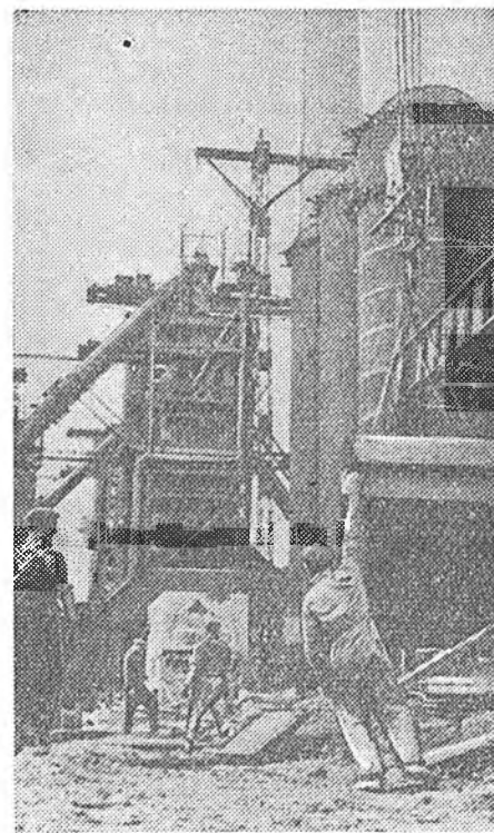
Чехословакийн Республика Купчпача бодожо байгаа Клемент Готвальдын нэрэмжата шэнэ металлургическа комбинатта гурбадахы доменно пешонэй барилга эхилбэ. Энэ пешон «Эб найрамдалай доменно пешон» гэжэ нэрлэгдэе. Зураг дээрэ: шэнэ доменно пешонэй барилга. Чехословакийн телеграфна агентство.

шудалха кружогууд байгуулагдаһай. Японой радиогоор ород хэлэнэй хэбшэлүүд дамжуулагдаа. Һүүлэй табан жэлэй туршда советскэ авторнуудай бэшэһэн 800 гаран номууд, тэрэшэлэн олон статья, элидхэлүүдэй япон хэлэн дээрэ оршуулагдажа хэблэгдэе.