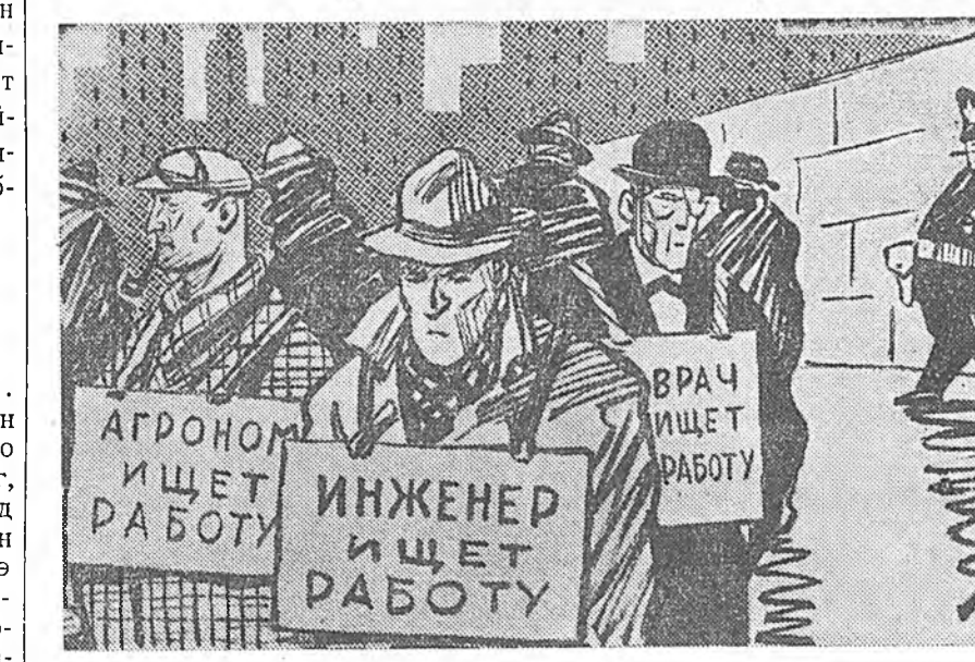
Капиталай оронуудта улам олон зон дээрэ: элдэб мэргэжэлтэйшы һаа, нэгэ ажал хүдэлмэригүй боложо байна. Зураг «ажалтай» зоч...

ВАШИНГТОН, августын 28. (ТАСС). Сэрэгэй 80 самолёт ябадаг, США-гэй айхбар авианосец «Эссекс» гэһэн шийдхэбэриэ да далайһаа гаража, Тайшадар байһан США-гэй флотые ошожо дэмжэхэ гэгэ-ралта үгтөө гээд Оборонны терство сонсохо. Эгээл шийдхэбэриэ 4 эсминец «Эссекстэй» гялсалса.