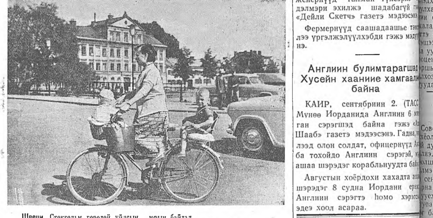
Швеци. Стокгольм городой үйлсын юрын байдал.

КАИР, сентябрин 2. (ТАСС). Мүнөө Иорданида Англин 6 мянган сэрэгшэд байна гэжэ «Шаша» газетэ мэдэсэнэ. Гадна, элдэ олон солдат, офицернууд ба тохойдо Англин сэрэгэй, ашаа шэрэдэг корабльнуудта байгаа Англин сэрэгшэд хэрэгшэ шэрэдэг 8 судна Иордани эрэн Англин сэрэгтэ номо хэрэгшэ эдээ хоол асаараа.