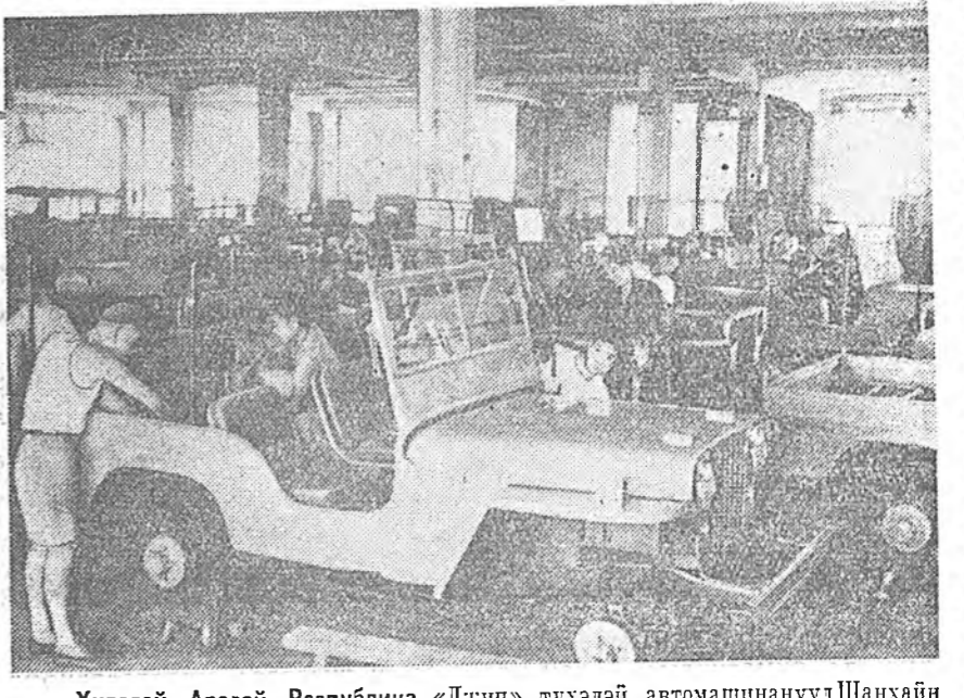
Хитадай Арадай Республика. «Джин» тухалэй автомашинууд Шанхайн автомобиль хабсаргадаг заводто олоор бүтээгдэжэ эхилэбэ. Зураг дээрэ: заводой цех соо автомашинууд хабсаргадажа байна.