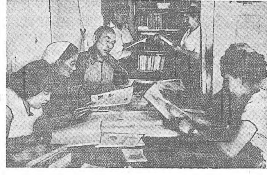
ЗУРАГ ДЭЭРЭ: Элһэнэй культбаза соо малшад ходоодо олон байдаг.

Энэ үгэнүүд үбгжөөлэй омог зүрхэн сооһоо орёёлтон гараа ёһотой. Бархан уулын хормойгоор колхозой 3 тосхон тобойлдоно. Хонхино, Элһэн тосхонууд—комплексно бригадануудай түб болоо. Эхин хургуулинууд, эмнэлгын пункттууд, нарайлалгын гэрнүүд, магазин, клуб, культбазанууд тэндэ бин. Айл бүхэндэ радио оруулагдаа, электрын гал ялараа. Хоёр тосхон хоорондоо телефонной шэжэм татаа.