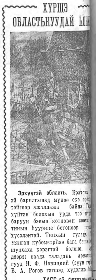
Эрхүүгэй область. Братскэй...