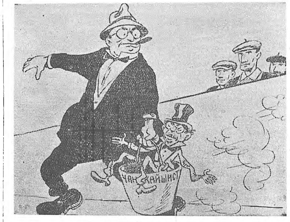
— Мистер, энэһине шорой шохой хайдаг газарта абаашахатнай гү? — Угы! ООН-до абаашахамни! ТАСС-эй фотохронико.

дөөр Алжирта асуулта үнгэрэгдэһэн байгаа шуу. Алжир арад тухай хэлэхэ болоо һаа, Алжирай Республикын саг зуурын правительствода тэдэнэр үнэн сэхэ байдаг дээрһээ, Алжирые сүлөөлхын түлөө тэмсэһые хүсэдөөр дэмжэжэ байһанаа үни хада элишэлэн мэдүүлһэн байгаа.