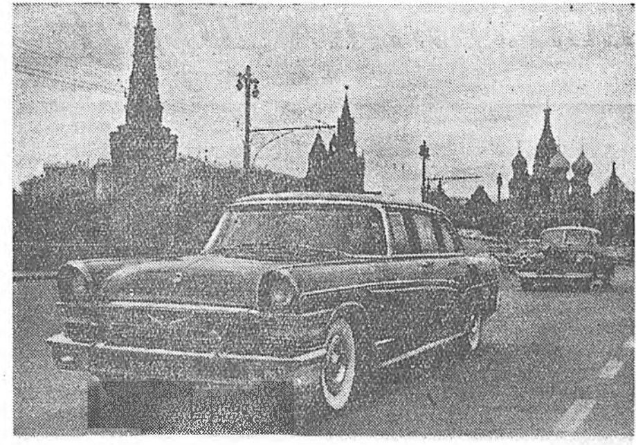
Москвадахи Лихачевой нэрэмжэтэ автозавод «ЗИЛ-111» маркын долоон хү- нэй һууритай таарамжатай зохид шэнэ хүнэн машинануудые бүтээн гаргадаг болоо юм. Эдэ машинануудые предприниитин коллектив КПСС-эй XXI съездэ бэлэг болгон бүтээхэн. Зураг дээрэ: «ЗИЛ-111» маркын шэнэ хүнэн автомобильнууд Москвагай үйлсэндэ ябажа байна.

Уран зураашадый хангалтаггүй- гөөр хүдэлжэ байхыс мэдэжэ бай- һан Культурын министр нүхэр Д. Ж. Жалсабон «наядаа тэдэниие дууджа асараад, шанга гэгшээр хөөрөлдэхэмнэ» гэжэ мэдүүлнэ.