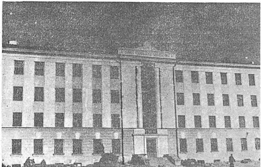
Зураг дээрэ: Бурядай экономика раионой совнархозой шэнэ байшан.