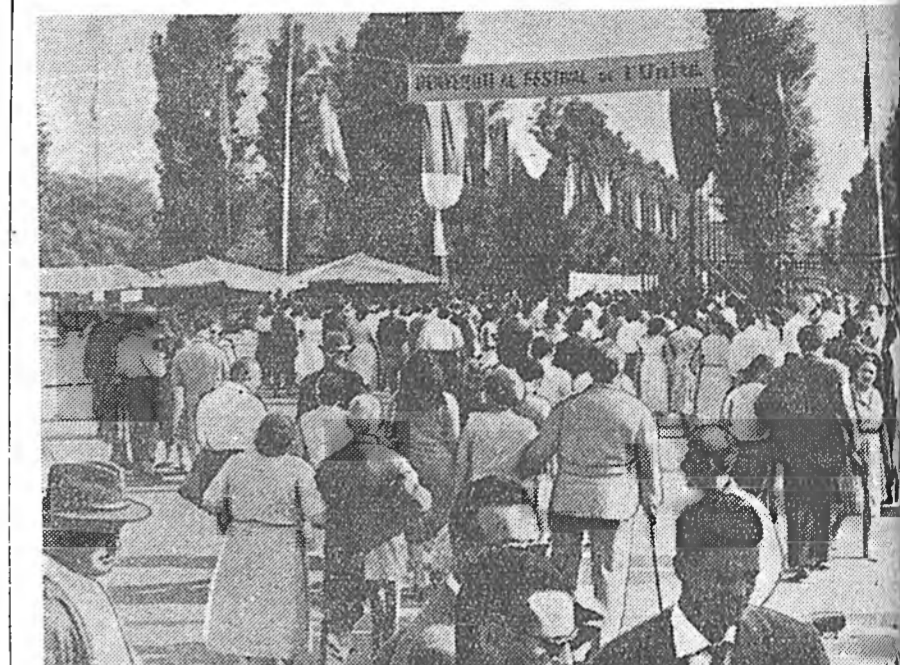
Милан. Италин Коммунистическэ партиин центральный орган «Унига» газетын заншалта найндэр найхан болоо. Хойто Италин олон нотагуудай ажалшад энэндэ хабаадаа. Италин Коммунистическэ партиин мэдээжэ ударнидагшад, тэрэ тоодо КПИ-гэй гэгэ генеральна секретарь Пальмиро Тольятти найндэртэ хабаадаа. Зураг дээрэ: найндэр боложо байна.

КАИР, октябрин 7. (ТАСС). Оманай бүхы хилые зүбшуулан, Англин сэрэгшэд, сэрэгэй техникэ сугларжа байна гэжэ Оманнаа мэдээсэгдэнэ. Энэ сэрэг оман арадай сүлөөлэлгын хүдэлөөе дараха гэгэн ехэ тулалдаандаа хабаадалсаха бэлдэхэнэ. Тинхэдэ Англин самолёдууд Оманай тосхонуудые зэрлиг муушгаар бомбодожол байна.