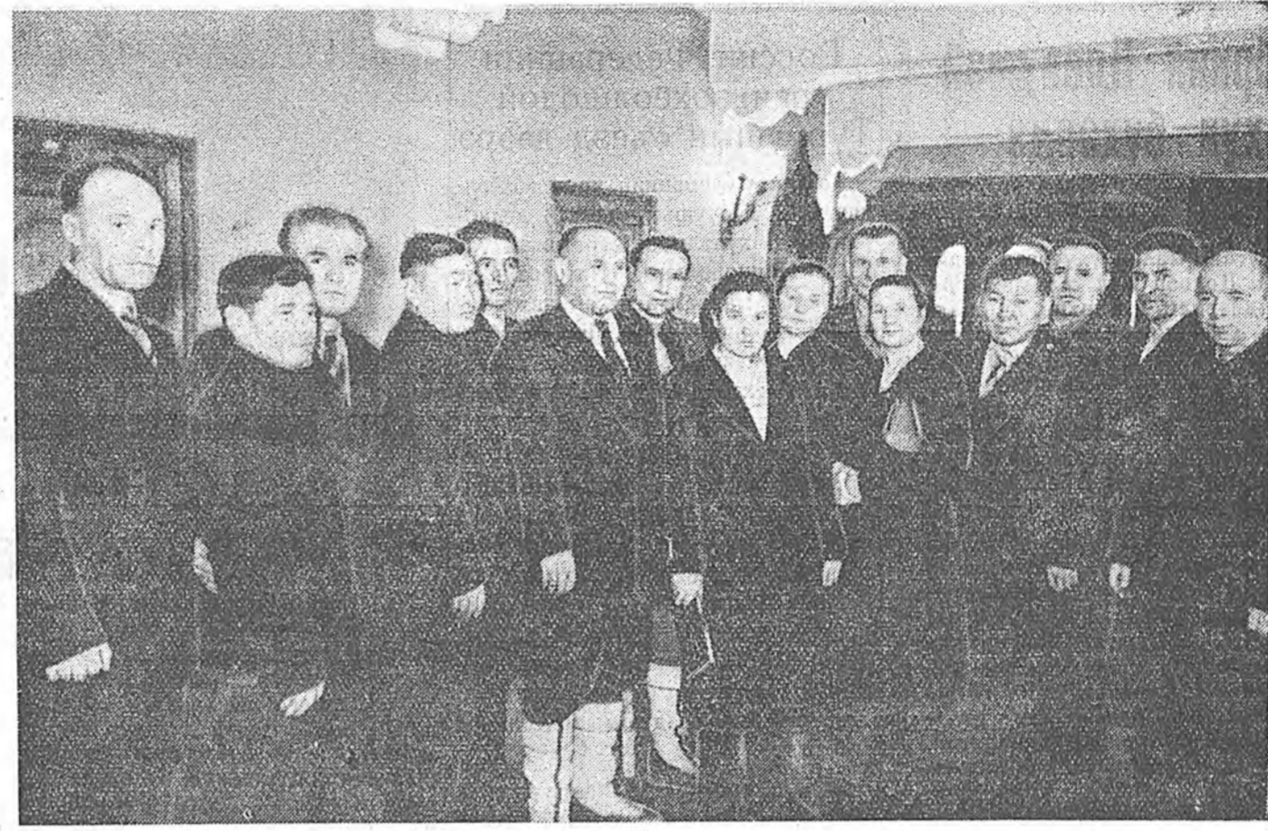
ЗУРАГ ДЭЭРЭ: областной ээлжээтэбэшэ партияна XXI конференциин бүлэг делегатууд.

Мүн республикын олохон предпритинуудта доторой арга боломжонуудые элирүүлхэ тухай бригаданууд эмхидхэгдэнэ. Манай ороной ажахые хүгжөөхэ долоон жэлэй тусэб болбол коммунизмын материально-техническэ база байгуулаха, гүрэнэй экономическа, бөөэ хамгаалха хүсэ шадалые улам ехэдхэхэ, арад зоной материальна болон культурина байдалые эрид найжаруулаха агууежэ программа гэжэ тоолон ажаллаха гэхэшэ бидэнэй нангин уялга мүн.