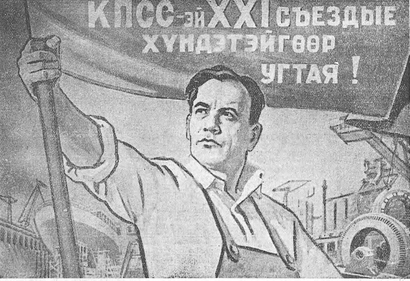
Уран зурааша С. Бондарай зураган плакат. (Зураган харуулгын искусствын гүрнэй хэблэн).