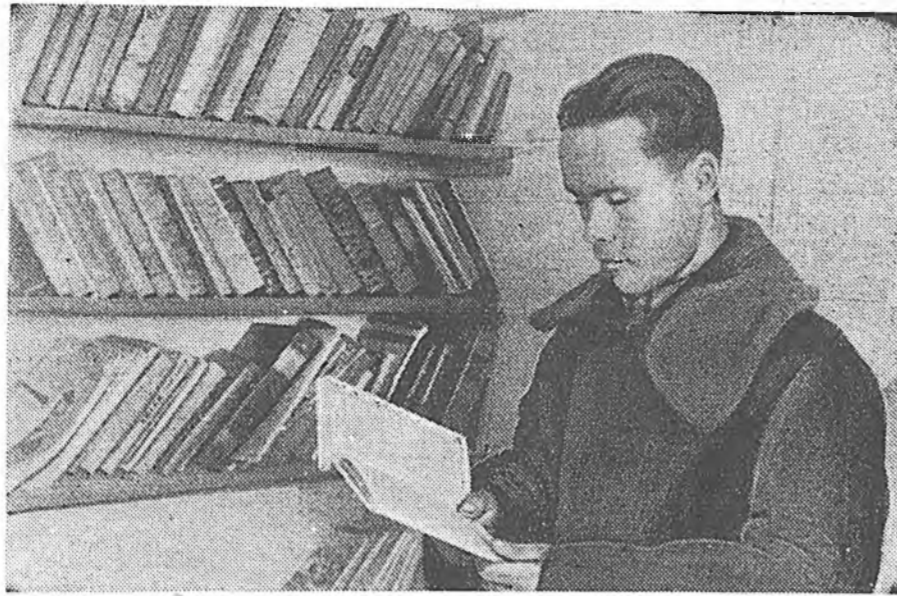
Һүдлэй үедэ республикнай колхозуудта культбазаууд олоор баригдажа, хаалшад, малшадай, хоншод, адуулашадай культурунар амрах гол гуламта боложо байна.

П. Ешеев, Яруунын аймаг хэблэл тараалгые эмхидхэгшэ.