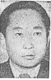
роль туданжай, түлөө оролдохын ехээр оролдогхо байна.