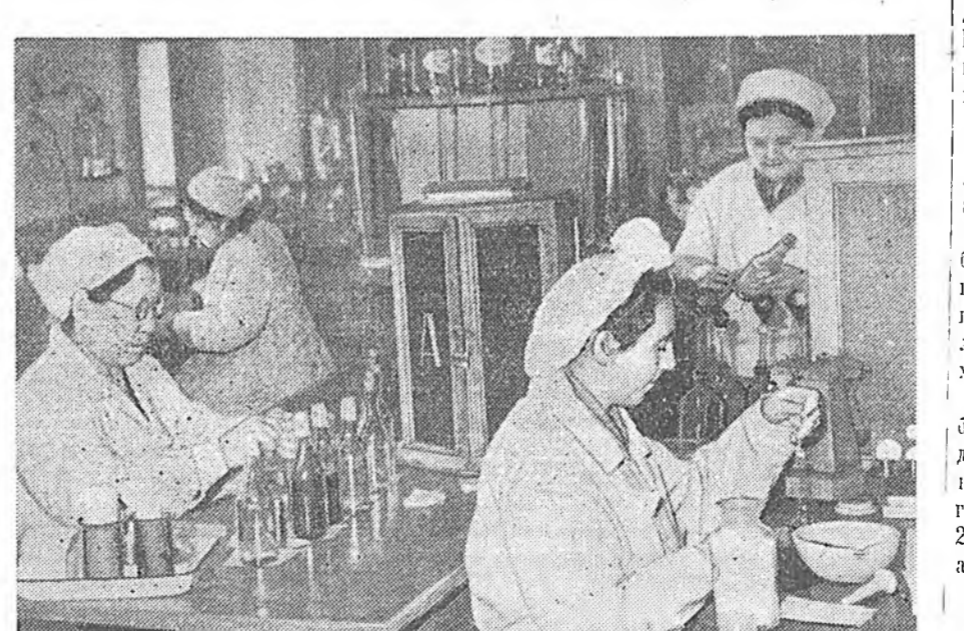
ЗУРАГ ДЭЭРЭ: аптекин хүдэлмэрлэгшэд ажаллажа байна.

Антон Адамович, та пенидэ гаража амархаар болоо бэшэ гүт? гэжэ асуухада: