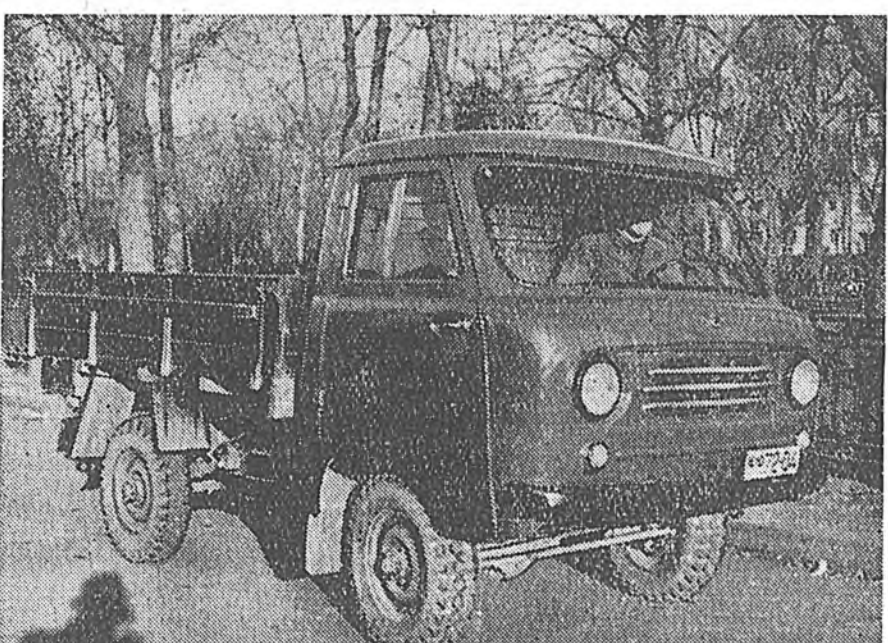
Москва. Түб хотымнай үйлсэнүүдтэ «УАЗ-450-д» маркын ашаанай шэнэ автомашинууд харагдадаг болоо.

Ульяновскын автомобильна завод энэ машиние һалнай олоор бүтээн гаргадаг болоо. Энэ автомобильда 67 моринной хүсэтэй, 4 цилиндртэй двигател табиһанхай юм. Машина 800 килограмм ашаа шэрэхэ хүсэтэй. Автомашини урдашы, хойтошы мөөрүүдэнь татадаг. Ашаанай энэ шэнэ машина горьдшы, худөөше шотагуудта үргэнөөр хэрэглэгдэхэ байна. ЗУРАГ ДЭЭРЭ: «УАЗ-450-д» маркын ашаанай шэнэ автомобиль.