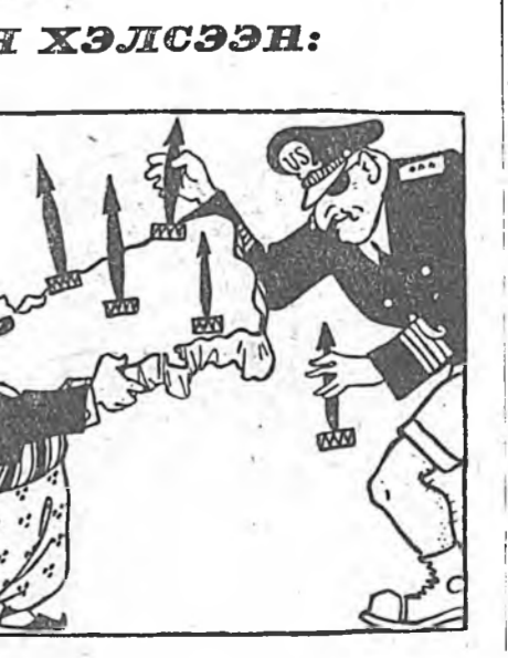
Нэгэ талаһаа— Турци өөрынгөө газар үгэхэ юм...