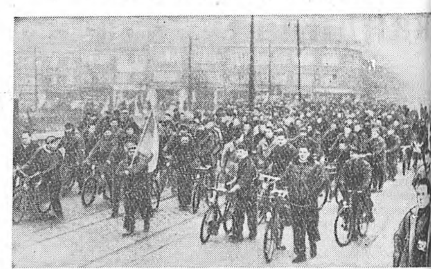
Франци. Францины хойто зүгтэ байдаг «Фив-Лилль» компаниин металлургическа заводуудай олон түмэн хүдэлмэришэд февралын эхээр демонстрацие байла. Компаниин заводуудта хүдэлмэри үгэхэ тухай ажалгүй металлургууд хэһэн арилые тэдэнэр дэмжэһэн байгаа. Зураг дээрэ: Лилль городей үйлэвэр демонстрантууд гараад абана.

Индин Республикын вице-президент Радхакришнан, Индин Центральна правительствын министрнүүд, бусад тусхай тушаалта хүнүүд, дипломатическа корпусой гэшүүд, олонингын болон хэблэлэй түлөөлэгшэд, тэршэлэн Делидэхэ советскэ эмхи зургаануудай хүдэлмэрилгшэд Индидахи онсо, бүрин эрхэтэ элһэн сайд П. К. Пономаренко түрүүтэйгээр Советскэ Союзай правительствена делегацие Палам гэжэ аэродром дээрэ утгаа.