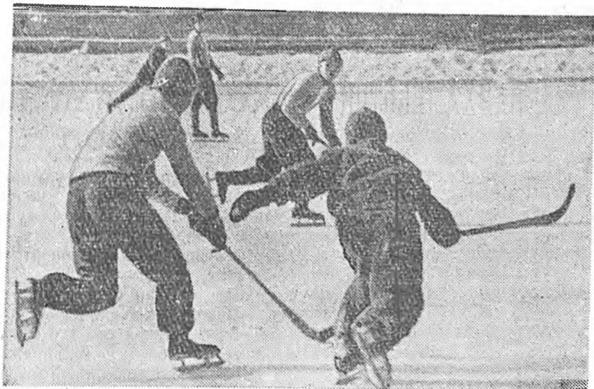
Хид Байкало-Кударын командатай уулзаба.

Нааданай түрүүшн хахадта хэн хээнгээ талада довтололсон, ямарше үргүйгөөр наадажа байараа, хэжэнгынхид нүгөөдүүлэйнгээ ворота руу түрүүшнэгээ бүмбэгэ сохижо оруулба. Удаан хоёрдохи бүмбэгэнь байкалокударынхидай ворота руу алдагдаба. Тингэжэ хэжэнгынхид нааданай забарлалта хүрэтэр 2:0 тоотой болоно байна.