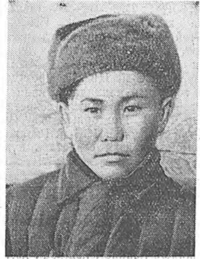
«Хүн болохо багаана, хүлэг болохо унаганнаа» гэж ард зоной хэлсэдэг тон зүйтэй гэш ха...