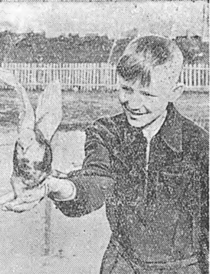
ГУЛУВХААТАЙ ХҮБҮҮН.