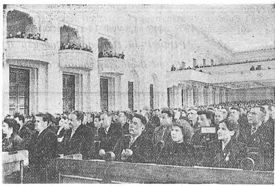
Москва. СССР-эй профессиональна ланин Ехэ ордон соо нэгэдэ.

Алжирай ажалшадтай бүгэдэ нийтингэ элдхэл түлөөлэгшэ хүэр Мошун Абдель-Кадер, Албаниин Арадай Республикн профсоюзундай центральна соведэй түрүүлэгшэ хүэр Гого Нушин, Корейн Арадай-Демократическа Республикн профсоюзундай нэгэдэлэй Центральна Комитетэй түрүүлэгшэ хүэр Ли Хе Сун, Японой профсоюзундай генеральна соведэй түлөөлэгшэ хүэр Иосико Минами гэгшэд съездые амаршалһан байна.