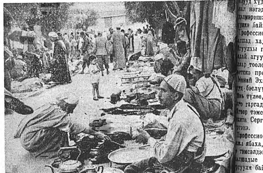
Маринно. Дэлгүүр дээрэ.

Химическэ промшленностиин хүдэлдэг 300 мянга шахуу үдэр дүүргэлгын, мэршэдэ салын хүлгэ 15 предпринимнууд тэрэ дээшлүүлжэ, нютаг нийтын хойноһоо та ажалай түлөөһэнэй ондо ажалшадай байлгы болуулаха, мүн бусад тэнүүды хэнэ.