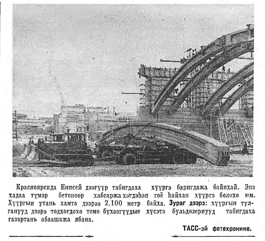
Красноярскда Бнисей дэгуун табигдаха хуурга баригдажа байһанхай. Энэ хадаа түмэр бетоноор хабаржа хэдэһан гоё найхан хуурга болохо юм. Хуургын утань хамта дээрэ 2.100 метр байха. Зураг дээрэ: хуургын тулганууд дээрэ тохдогхо томо бүхээгүүды хүсэтэ бульдозернууд табигдаха газартань абаашажа ябана.