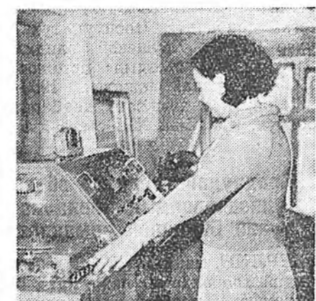
уншанан шүлэг, расказауд, жүжэг нааданууд, дуушадай хонгёо дуунууд бултадаа энэ лентэ дээрэ бэшгэдэг, радиостудияда эльгэгдэжэ, дээрэ хэлэгдэнэй ёһоор бүхы республика доторнай тарадаг юм.

гэ захиана нүүгэ захала хүрэтэр тодхогдонон, хүүлэй үеын шэб шэнээн аппаратууд яларжа байха. Эдэнэй тодхогдононон хойшо радиогой абяан хараа байса хайжаранхай. Дикторэй сонсохотой сацуу аппаратай шуур талдахи улаан гал унтаргаад, тэрэ дүгэ ондоо гал ахаха. Тихэдэнэ нүүгэ таһалгада байгааша баһал шэнээн магнитофонуд дээрэ тодхогдонон, түрүүшээр харахада патефонной пластинка шэнги аад, нарийхан, цимгэн лентэ эрбелдэжэ захалха. Энээн дээрэ абяан бэшээтэй байна ха юм. Тэрэмнай долгин дэвгүүр дамжан ниндэжэ, радиостанциин орбо оньһон аппаратуудта хүрөөд, республика соогуураа таран дэгдэнэ. Мүнөө радиодоо пластинка огто хэрэглэхэе болбод, али бүхы абяанууд «магнитофильм» гэжэ лентэ дээрэ бэшгэдэг болонхой. Энэмнай харшаганаһан, шаршаганаһан абяа гаргадгүй, ехэл һайн юумэн даа.