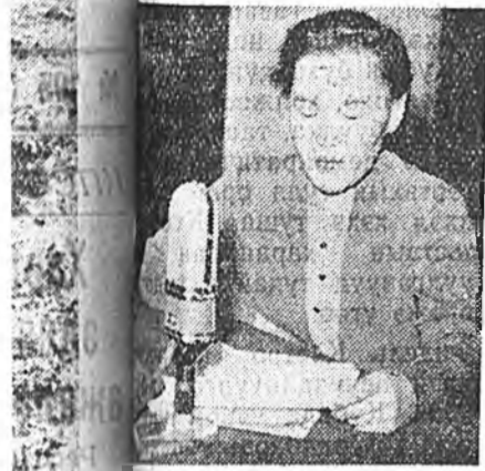
6 час 25 минутад Союзай Гимнын наадагдүүлээр, «Улан-Удэ хэлэжэ Амар мэндэ хүргэнэбди, радио шагнал!» Манай гауудыне 1067, 48,9 долларыг шагнахат» гээн ород, Викторүүдэй мэдээсэл эфирэстожо, ажалшан бүхэниие цаг, ажал хүдэлмэри тээдэг юм.

Улан-Удэ хэлэжэ Амар мэндэ хүргэнэбди, радио шагнал! Манай гауудыне 1067, 48,9 долларыг шагнахат» гээн ород, Викторүүдэй мэдээсэл эфирэстожо, ажалшан бүхэниие цаг, ажал хүдэлмэри тээдэг юм. Улан-Удэ хэлэжэ Амар мэндэ хүргэнэбди, радио шагнал! Манай гауудыне 1067, 48,9 долларыг шагнахат» гээн ород, Викторүүдэй мэдээсэл эфирэстожо, ажалшан бүхэниие цаг, ажал хүдэлмэри тээдэг юм.