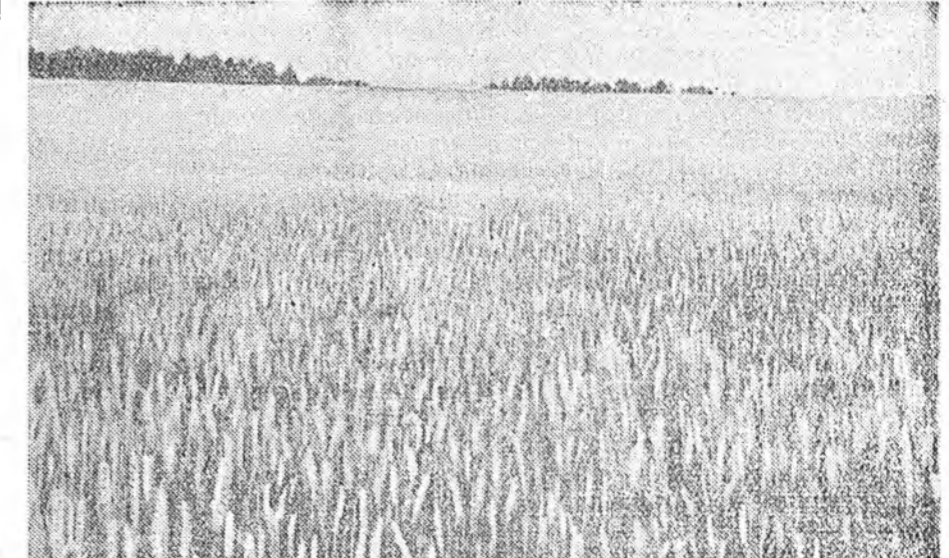
ЗУРАГ ДЭЭРЭ: Свердловэй нэрэмжэтэ колхозой Оиника гэжэ газарта ургаланнуу пүүдэй ургаса. (1958 оной намар хэгдэнэн зураг).