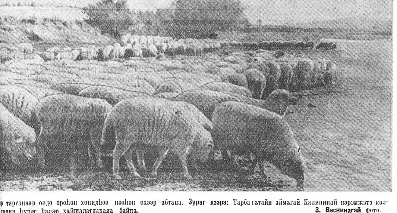
тарганаар ондо ороһон хонидо ноһон эхээр абтана. Зураг дээрэ: Тарбагатай аймагай Калининэй нэрэмжэтэ колхозини һураг һааяр хайшалагдаһаа байта. 3. Веснинагай фото.

коорон- ай ху- хо са- д-г-гэй аг- нгөө- рса- сто- ар- жэ- бол- це- зай- сов- вор- врн- адта- дэн- па- Ула- убко- ар- Зуу- ронт- н- Ун- нерал- лдар- вска,- лда- алса- Ни- бай- удар- шаад- спуб- элбэ- тоо- нар- таһан- хэлэн- равн- оһон- талай- һун- арал- эхэ- анво- ноор- зедэй- мота- говто- ма- дтэй- э сү- гэжэ- Ива- яна- шье, - до- нир- нии- лса- за- хү- а. - св. - озай- улха - бүү- юм. - ба- гада - чууд- унда - соёл - буу- пар- агай- заши - ёһо - в. - со- бол- нээ- ду- ээр, - ури- лэн - нжэ - рхэ - иче - сөд - лэн - зүг - аха - мэн - вэн - элэ - ээр, - нгн - йл - энэ - жэ - ? - үү - лан - мэ - тэй - тү - до - йн - жа - цы - гүй - ны - хн - дэг - ха - үхэ - һа - ргэ - энэ - таб - бод - эд. - тон