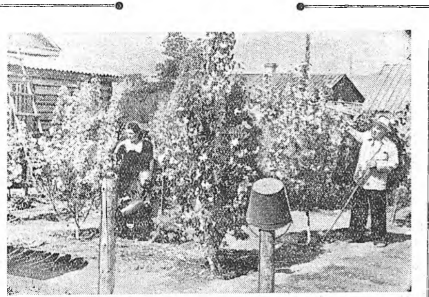
Гусиноозерск городой ажаллаа газгаага ура жэмэстэ модонууды тарижа, мүү бшэ ургаа хурлаага. Жэнеэнь, Бекасовай будынхид ур жэмэстэ модонууды олоор тарижа, хайн ургаа хурлаагаараа город соогоо суутэй болонхой юм. Энэ айтай газга мейфон, яблока, вишни, үхэр нюдэн, улаагана гэхэ матэ найнаар ургана.

Зураг дээрэ: Бекасовтан сад соогоо ажаллажа байна.