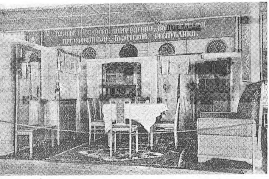
Зураг дээрэ: байрын гарай нэгэ табалга. Мебельнэ фабрикын бүтээнэ мебель.

«Кооператор-Комсомолец» гэжэ олзборилгын артелиин бүтээн гаргалан зүйлнүүд павильон соо үргэһөөр харуулагдана. Гална энэ артелиин уран гартанай хуйхаар, яһаар элдэб юумэ уралан хэһэнһини хүн зонинэ хонирхуулба. Бурят хутага, гаһаа, бурят гутадай дүрэ, элдэб эсын шубуу болон бү-