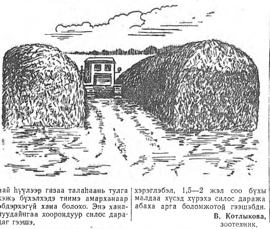
най нүүлээр газар талаанаан тула хэжэ бүхэлхэдэ тинмэ амарханаар эбдэрхгүй хана болохо.

Тэндэхи колхозууд, совхозууд силосые тэгшэ газар дээрэ дара-хынгаа урид доболон, уянда абта-хэгүй, хуурай газар бэдэржэ олдо-дог. Тингээд тэрэ газараа нойтон шабараар хайса хушадаг юм, Нүү-дээрн тэжээл хая сабиангдан но-гоогоо зөөжэ 4-6 метр үргэнтэйгөөр, 3 метр үндэртэйгөөр сомодог.