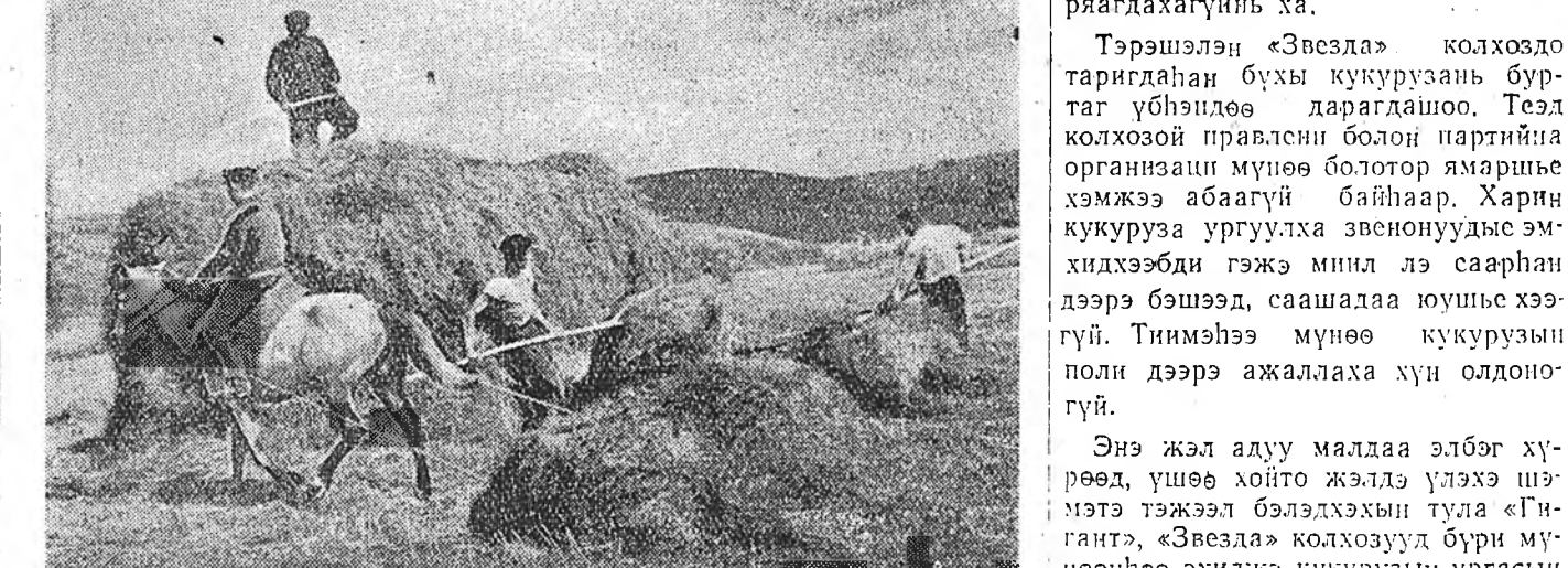
Мухаршээрэй аймагай Калининэй паремжэтэ колхозой табдахи комплексно бригадынхид үбнэ хуряалга түрүүшын үдэрнөө үбнэ сабшала, хуряалга, түлөө эхэн оролдого гаргана. Зураг дээрэ: тус бригадынхид үбнээ һүрлэжэ И. Мунисовой фото.

Гэбшье колхозой бусад звенуудта кукурузын хойноһоо харууналха хүдэлмэри тон һулаар ябуулагдажа байна. Жэшээлхэдэ, энэ колхозой нүхэр Зверьковой хүтэлбэрилдэг звеногойхид байгша ондо даажа абһан газарайнгаа гектар бүриһөө 300 центнержэ доошо бэшэ эшэ набша хуряажа абаха гэһэн үсхэлэ гаргаһан юм. Тэд хүрөө тэдэнэр хэлэһэн үгэдөө мүнөө түлөө эрил шууд тэмсэнгүй гэжэ эхэ хэлэхэ хэрэгтэй. Звенодо даалгагдаһан зарим участогуудта кукурузань оройлоосине ургаагүй, харин газар дээрэ гарһан эшэнүүдын буртаг үбнэлдөө баригдажа, саанялаа ургаха шадлаа гэжэ байһаа. Эдэ мэтын дутагдалнууд юун дээрэһээ болоһон гэхэдэ, тус звенодо ажалай журам тон һула, зарим гашуудын ажаллаа гаралдаггүй дээрэһэн болоо. Тэд нүхэр Зверьковой даажа байһан участок эгээл һайн үржэлтэй газарта юм. Хэрбээ тус звеногой участоуды бүри мүнөөһинөө эхилжэ элдүүрлэггүй һаа, биратай ургаса хуряагдахагүйн ха.