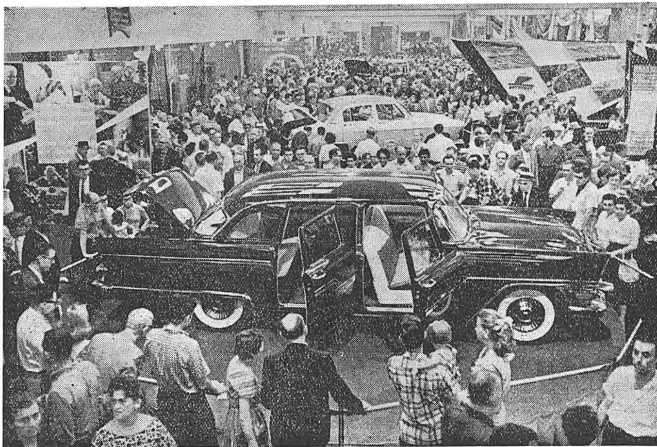
Нью-Йоркдохи Советскэ выставка. Горьковско автозаводой бүтээжэ гаргаһан «Чайка» гэжэ автомашины выставкадэ орогшод хаража байна.

ПЕКИН, июлин 20. (ТАСС). Сяньхуа агентство ингэжэ дамжуулаа. КНР-тэ хамаатай Пинтань, Байцзоань (Фуцзянь провинци) шадарай уһанда июлин 20-до Америкийн сэргэй корабль ороһон байна.