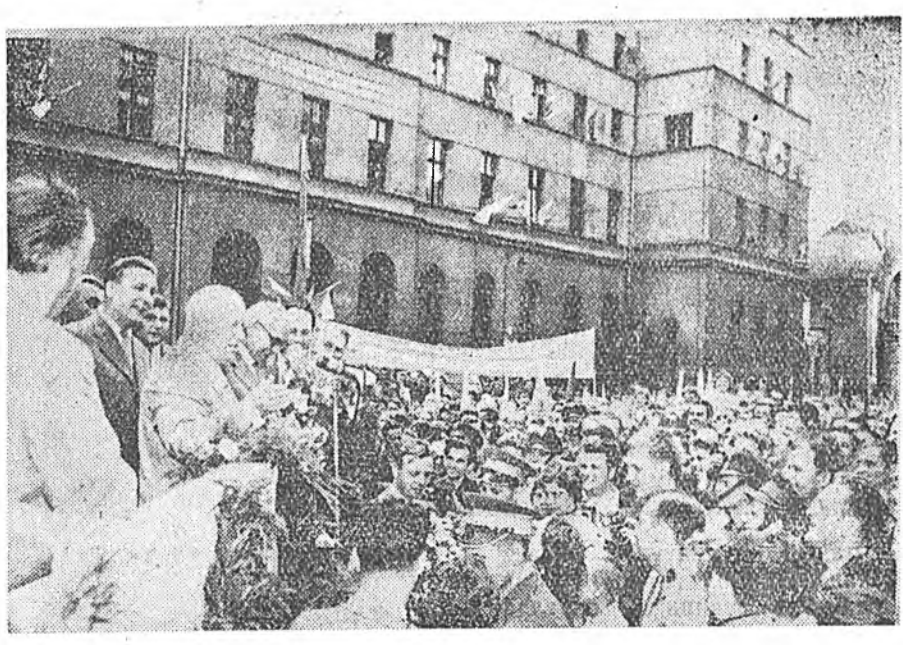
Польшын Арадай Республикна. Советскэ Союзай партино-правительствена делегаци Катовице городто ошоод байна. Зураг дээрэ: городой амалшад нүхэр Н. С. Хрущевые амаршалаа байна.

Элэ үдэрнүүдтэ бүхы Польша—Балтийска далайнаа Карпайда хаданууд хүрэтэр, Буг мүрэнһөө Одер хүрэтэр арадай засаг тогтоһоноо хойшо 15 жэл гүйсэһэнэй ойе тэмдэглэжэ байна.