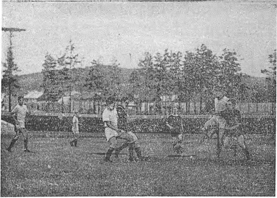
Уржадер БурАССР-эй 25 жэлэй ойн нэрэмжэтэ стадион дээрэ Улан-Удын ПВЗ-гай «Локомотив», Кяхта городой футболистнуудай командын хоорондо нүхэрэй ёноной уулзалда үнгэргэгдөө. Энэ уулзалгана «Локомотивай» футболистнууд шүүһэн байна. Зураг дээрэ: Кяхтын командын воротатай дэргэдэ.