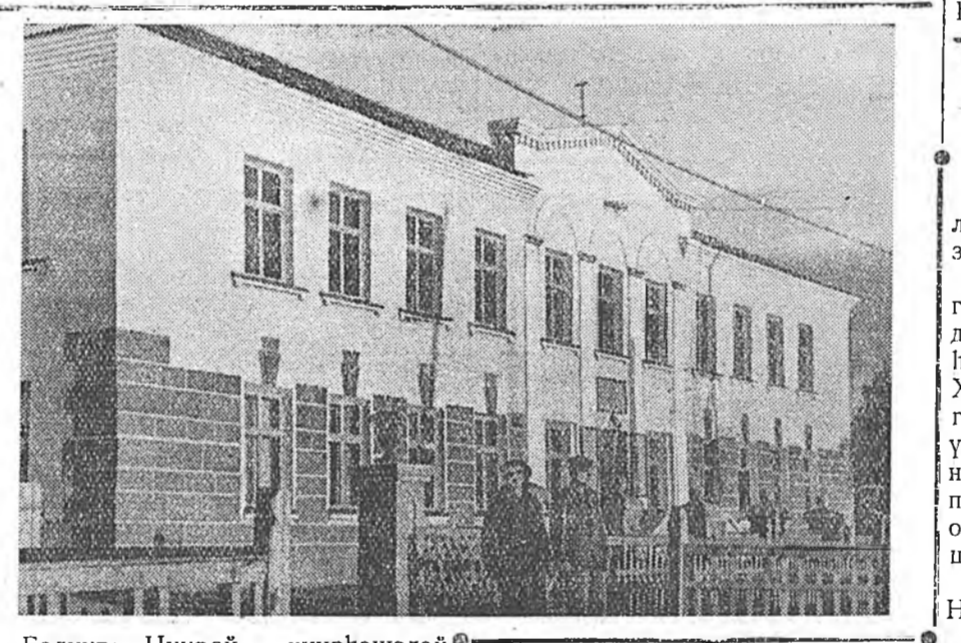
Галуута Нуурай нүүршэдэй город Гусинооерск жэл ерэхэ бүри болбосон түхэлтэй болоно. Нүүрһээшэдэй ажаһуудал улам найжарина, культирня боложо байна.

Городой ажалшаддай ажаһуудалай эрилтэ хангаха тусхай комбинат баригдажа, наяхан ашагдалагда үгтөө. Энэ комбинатай уужам, һаруула таһагуудтань парикмахерска, фотоателье, выставкы зал, хубсаһа оёхо, ажаһуудалай элдэб хэрэгсэл заһабарилха олон мастерскойнууд хүдэллэ.