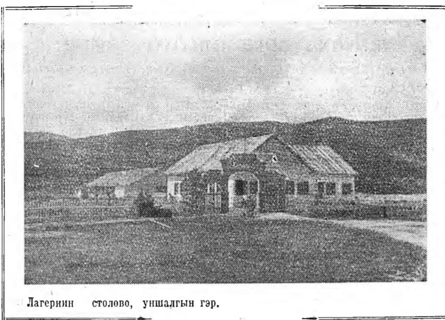
Лагерини столово, уншалгын гэр.