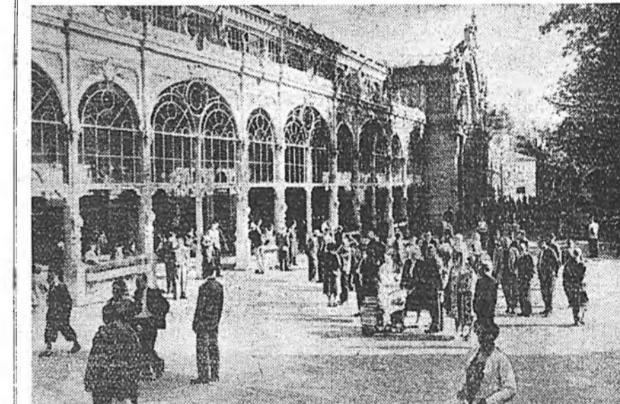
Чехословакиин Республика. Ажалшадтай элүүрые хамгаалха хэрэгтэ ара-дай гүрэн ехэ анхарал хандуулаа. Орон дотор 50 гаран санатори бии. Тэндэе ошожа ажаллад эмшалуудад, амардаг байха юм. 1959 оной нэгэдэхэ квар-талда 55 мянган хүн курортдо ошохо нутбөсонуудые түлөөлөгүүдөөр абалан байна. Зураг дээрэ: Курорт-город Марианска-Лазньдахы Максим Горькийн нэрэмжэтэ колониядо.