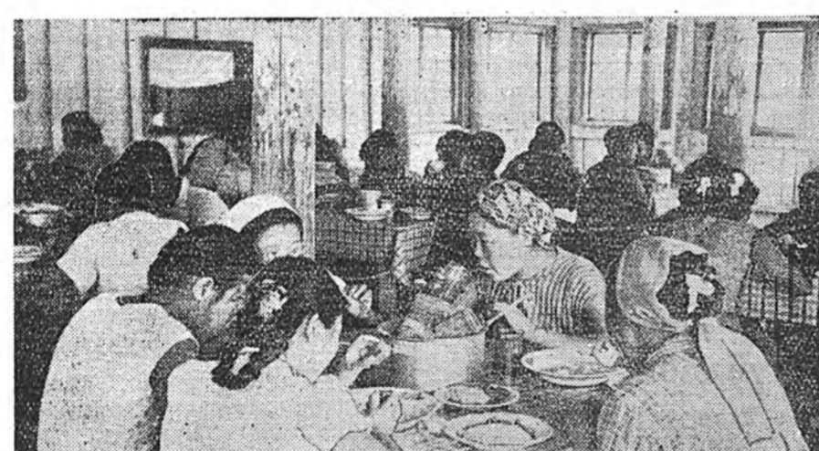
Удын хоолой үедэ столово соо.

Лейт хадануудай үбэртэхи булан то-дой газарта хайтайхан табиг мэтэ түхөөрөн-сүгэтэй нуурай шөрүү найшаг гаранан-уранай тулан доро холобоо ялазэн ха-милана. Эмнэй Хүхэдэй нуур... Юун гэг-э хонирхолтой нэрэ гэшэб? Нуурай түн урдахн шоб шобогорхонууд, нисэгэн-нэр ууланууд хонирхолтойгоор харгана. Урдын нуурай ара талада шугы бур-хайнаа, бөлшэжэ ябанан малнууднаа-нш юмхон харгаддаггүй бэлэй. Харин түдэй 2—3 жэлэй туршад тэндэ сагаан-ойрой томо, жэжэ гэрнүүд, майханууд, хэдэр баханын оройдо намилзадаг улаан-түдүд харгаддаг, багашуулай хүхюун-нээдэн, шаг шуулан холобоо соностожо, түнн ойе эдэлүүлдэг болонхой. Наза хажуугайн эржэгэр хорёгой-ууд хашана зунай тухлалэй хоёр томо бай-ганууд барилжаа дүүргүүтэй хэдэн ба-рилганууд байна. Нэгэнһэньн хара утаан-ааршаана. Газаагуур хүнүүд харганагүд-ай хургуулай урдахн талмай дээрэ элдэб-үрэнэй огородой эдсэн, үнгын сэгсгүүд, кукуруза гэхэ мэтэ ургажа лууна. Клуба, урланууд ехэ ямбатай зохидохоор хэг-рэлхэй. Үглөөнэй 7 час... Набтар ута гэрһэ-дэ барилганаа булхайтар горно үлэжэ бо-лгоно дохо наадана. Удгүй хая хаа-агүдэй хөөрсөгэй боложо, ехэ баг-ааршаан, һүүхирлэдэн, энээлдэн соностоно-Эмнэй Улан-Удын 1-дахн интернат-хургуулин лагерини хурагшад унтари-нһа нута харайн бодожо, газашааа гүйл-гэн гараад, физзарядка хэжэ хэргэнэ. Түдээрнэ аришууд, мыжэ гэхэ мэтэе ба-