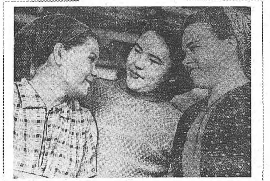
«Механлит» завод дээрэ комму