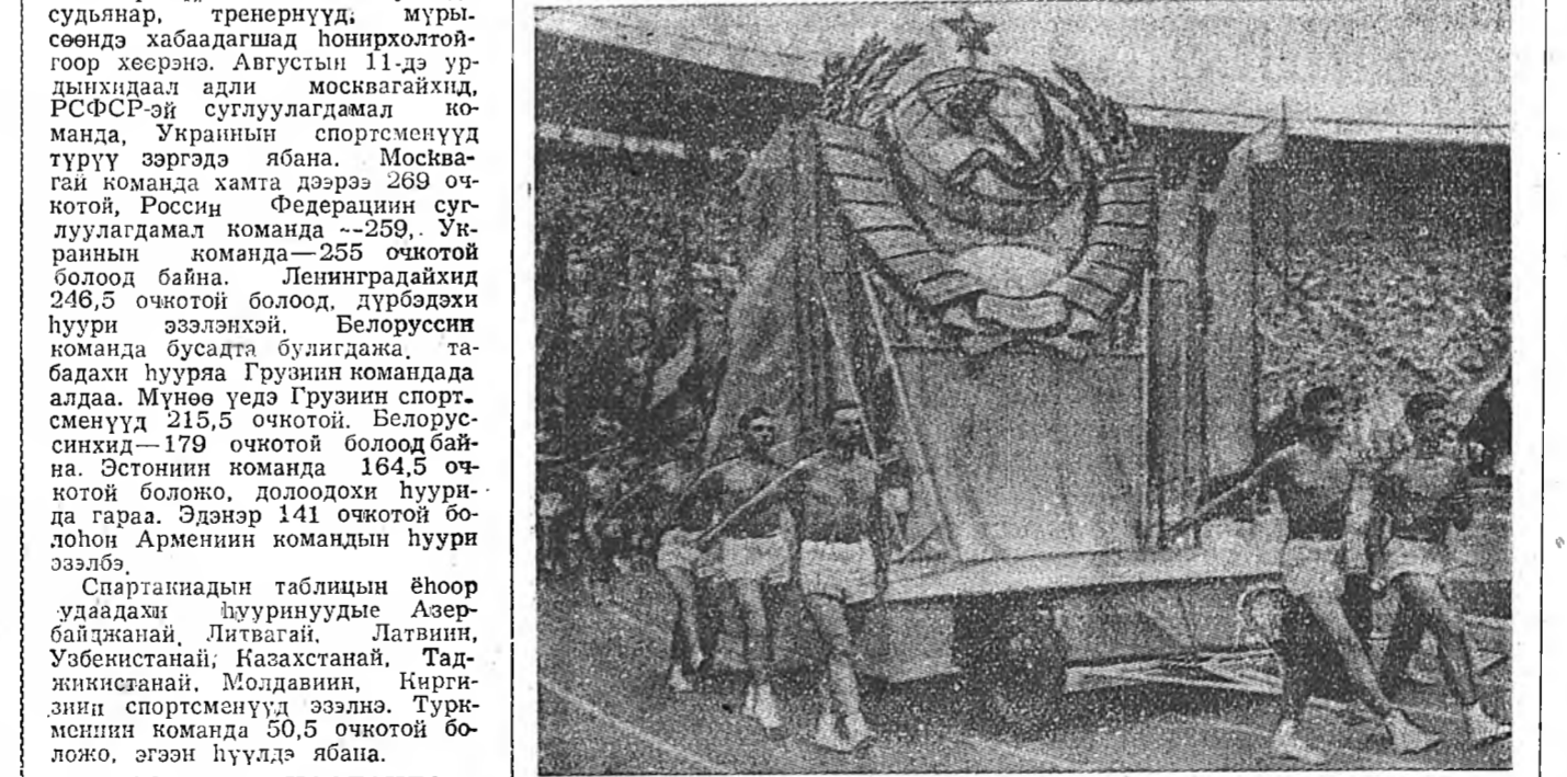
ЗУРАГ ДЭЭРЭ: Спартакиадада хабаадагшадай баяр ёһололой парад-Түрүүшн колонно-ТАСС-эй фотохронико.