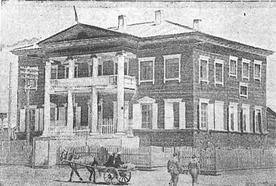
Ново-Селенгинскдэх түүхэтэ памятник. Энэ байсан декабрист Николай Александрович Бестужевай проектээр баригдан байгаа. Мүнөө энэ гарт аймагай пионерүүд байрланхай.