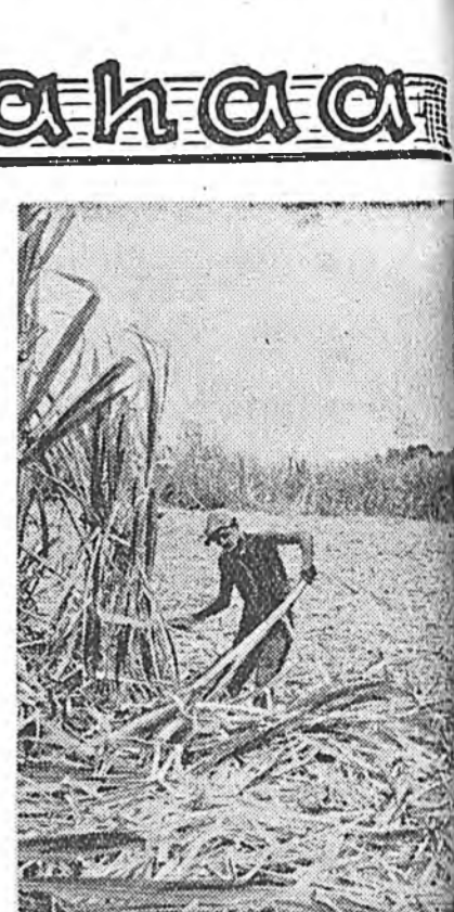
Куба. Гавана провинцидахи «Телега» гажэ заводой плантаги дээрэ сахары тростник хуряажа байна.

нэрэгэлгы энэ оной октябрин 31-лээ жэлэй эсэс хүрэтэр хойшошуулха гэһэн захиралта президент Эйзенхауэр гаргаа гэжэ США-гэй гүрэнэй департамент мэдүүлээ.