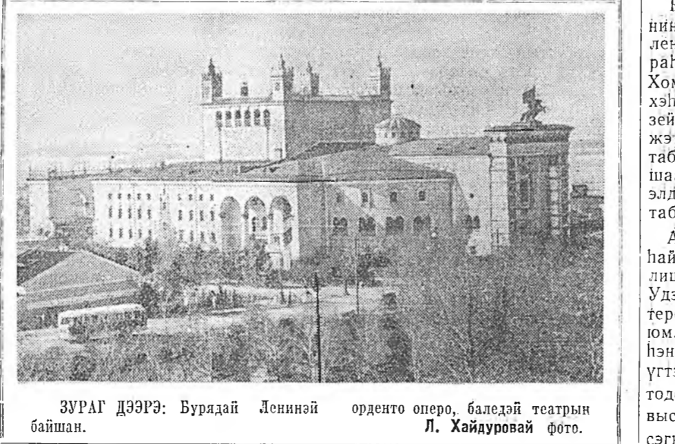
ЗУРАГ ДЭЭРЭ: Бурядай Лениний орденго оперо, баледэй театрын байшан.