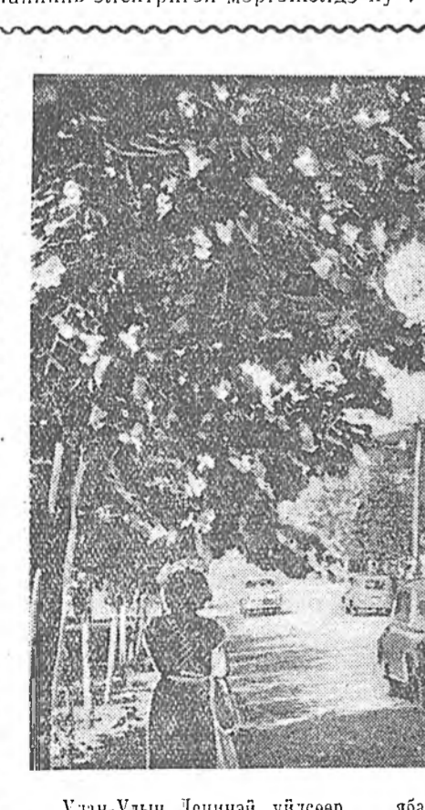
Улан-Удын Ленинэй үйлсөөр ябахдаа...

Залуу хүдэлмэришэд абыастайгаар хүдэлхэ, сэнгэлдээр амархынгаа хажуугаар элдэб спорт эрхилнэ.