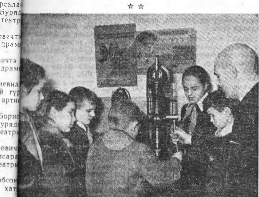
Урагшад дээр: механическа мастерскойдо урагшад станогтой танилсажа байна.