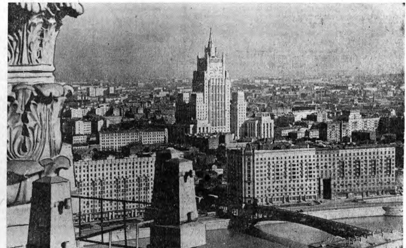
ТҮРЭГ МОСКВАННАЙ.

Ажалай Улаан тугай орденуор 38 хүн, «Хүндэлэлэй Тэмдэг» орде-нуор—86, «Ажалай габьяагай тү-лөө» медалаяр—109, «Ажалдаа шалгарһанай түлөө» медалаяр—101 хүн шагнагдаһан байна.