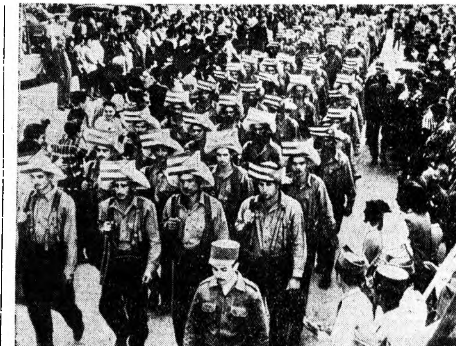
Оройонгоо баатар Антонио Масео гэгшын наһа бараһар 63 жэлэй ойе Кубын арад 1959 оной декабрыда тэмдэгдээ. Испаниин колонизаторнуудтай болодон тэмсэлэй үедэ тэрэ наһа бараһан байгаа. Зураг дээрэ: Гаванын үйлсэнүүдтэ парад боложо байна.

Сэрэгэй эхэ гэмтэдэ сүлөөлхэ гэрэн ханаашалгы буруушаан бэ-шэгтэ митингдэ хабаадагшад нэгэн ханалтайгаар гараа табяа.