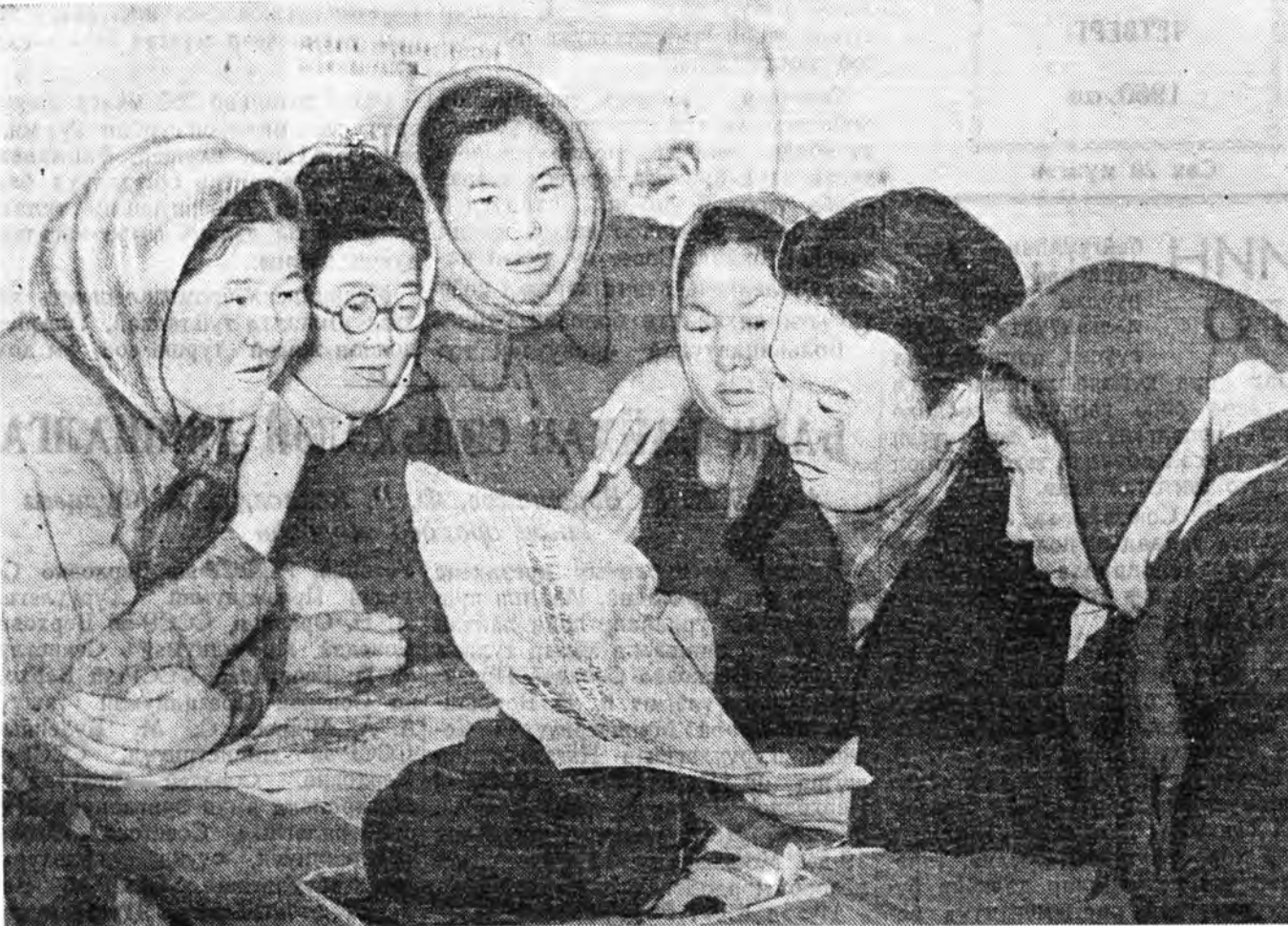
СССР-эй Зэбсэгтэ Хүсэнуудые дахин нилээд ехээр хороохо тухай Хуулине үдөөгэй ажалшад угаа ехэ баяр баясалтайгаар угтаад, Эхэ оройногхой саашаа урган найрамдын түлөө эршэмтэйгаар ажаллахада гэжэ мэдүүлнэ.

Кяхтын хониной совхозой 4-дхи фермын механик.