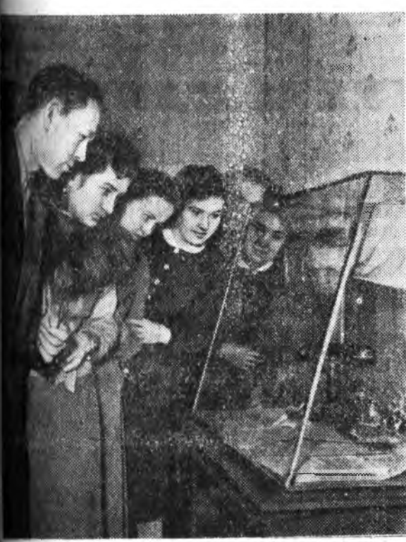
Ленинград, Смольно... Энэ гэр тухай дуулаагүй хүн байда. Завсэгтэ востанин үедэ Владимир Ильич гурбадахы дахарай нэгэ табалга соо ажануужа. Октябрийн революцие ударидажа байһан үеэ Зург дээрэ: экскурсантууд Смольнодо В. И. Ленин партирадахы телефон хаража байна.