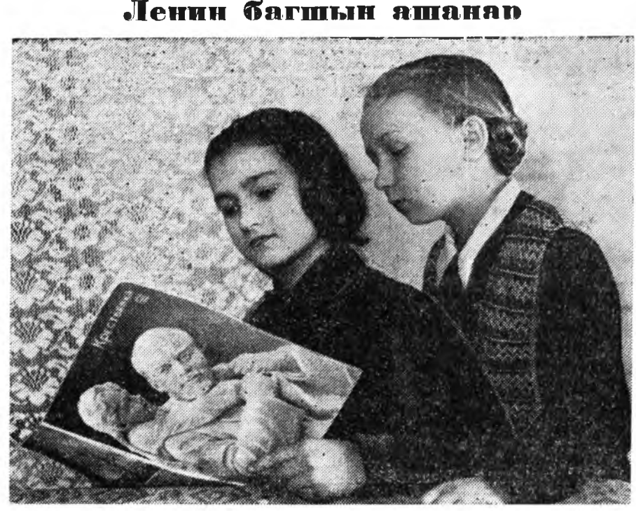
Ульянов багшамнай, заяата эсэгэмнай Уриханаар энэбхилэн, дулааханаар шэртэн, Мрамор табсаннаашье, номой хууданнаашье Маанадаа мэндэшлэжэ, илалтада уряална. Бургаал заабариень наринаар бээлүүлжэ, һаруулан ерэдүйгөө бодхоолсохын тула «Һураха, һураха, үшөө дахин һураха!»— һайхан юрөөлыень дүүргэхэбди бидэ!

Радиорелейнэ харилсаан Республика дотор Зэдн аймагай түб—Петропавловка Джида станци хоёрой хоорондо радиорелейнэ харилсаан анха түрүүшынхэ бин болгодобо. Иймэ харилсаа бин болгохын урда тээ тус хоёр хууринай хоорондо телефоноор хөөрэлдэхэ гэшээ ехэ бэрхэтэй байһан юм. Мүнөө радиорелейнэ телефонно, телеграфна линин бин болгодоод байхада, Петропавловка тосхон түмэр замай Джида станци хоёрой хоорондо наадгүйгөөр хөөрэлдэхэ харилсаан байгуулагдаба.