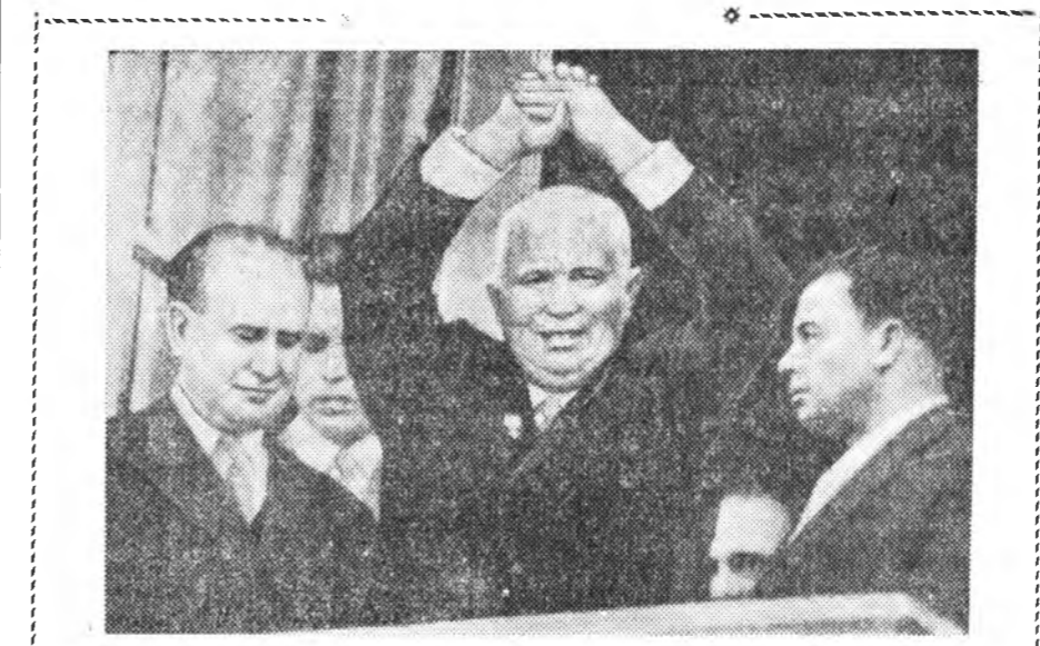
ЗУРАГ ДЭЭРЭ: Н. С. Хрущёв Францин нислэл хотодо байрлаан Кэ д'Орсэ гэжэ байшангай балкон дээрэээ хүнүүдэй амаршалануудта харюусажэ байна.