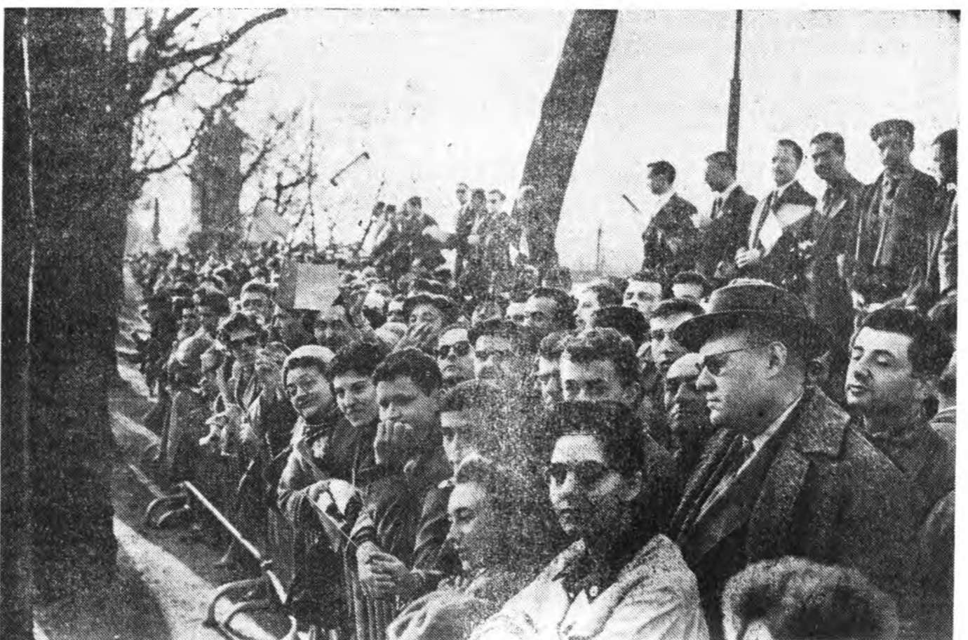
Париж. Н. С. Хрущёв хулёжэ байхан үе.

Советскэ правительствын толгой-логшо үдэшлэн По город (Доодо Пиренейн департамент) ороо,