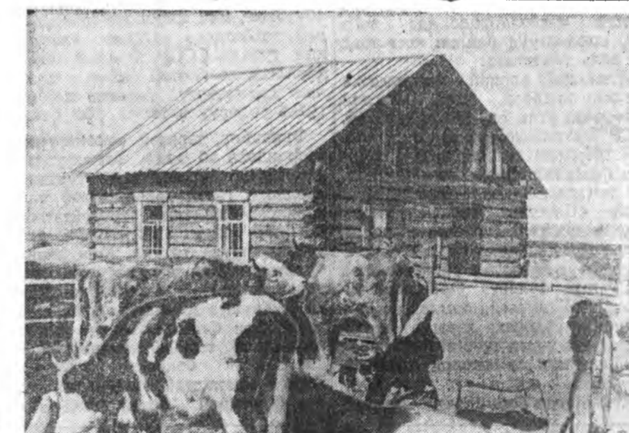
ЗУРАГ ДЭЭРЭ: «Сибиряк» колхозой 1-дехи фермэдэхи искусственна үр-жүүлгын пункт.

Унеэд тугаллан сагһаа хойшо 18—20 хоноот ототой болохо ёшо-той. Энээхэн үедэнь найса адалга-жа байгаад, отонийн үнгэрхын ур-да тээхэн үржүүлгэдэ хайн. Унеэ-дээ үржүүлгэдэйнгээ үржүүлгэдэ нара болоод байхандаа эрдэмтэ нүхэр Со-коловскийн заабаряар үнеэдэйнгээ хээлитэй болонынь шалгадагди. Хэрбээ хээлитэй болоогүй байгаа хаань, хоёрдохёо үржүүлгэ хэрэг-тэй.