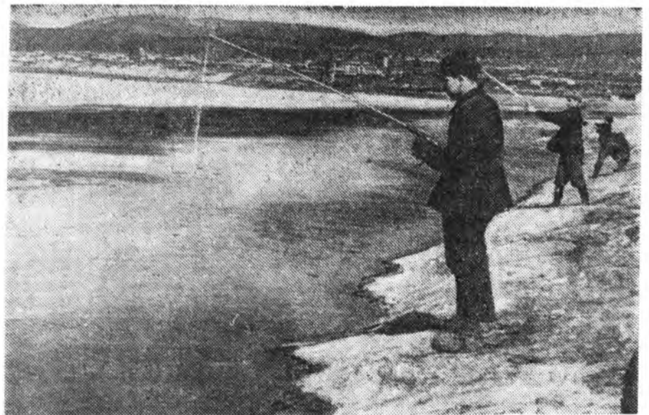
ТҮРҮҮШЫН ЗАГАБАШАД. Б. Цыремпиловэй фотоһтоод.