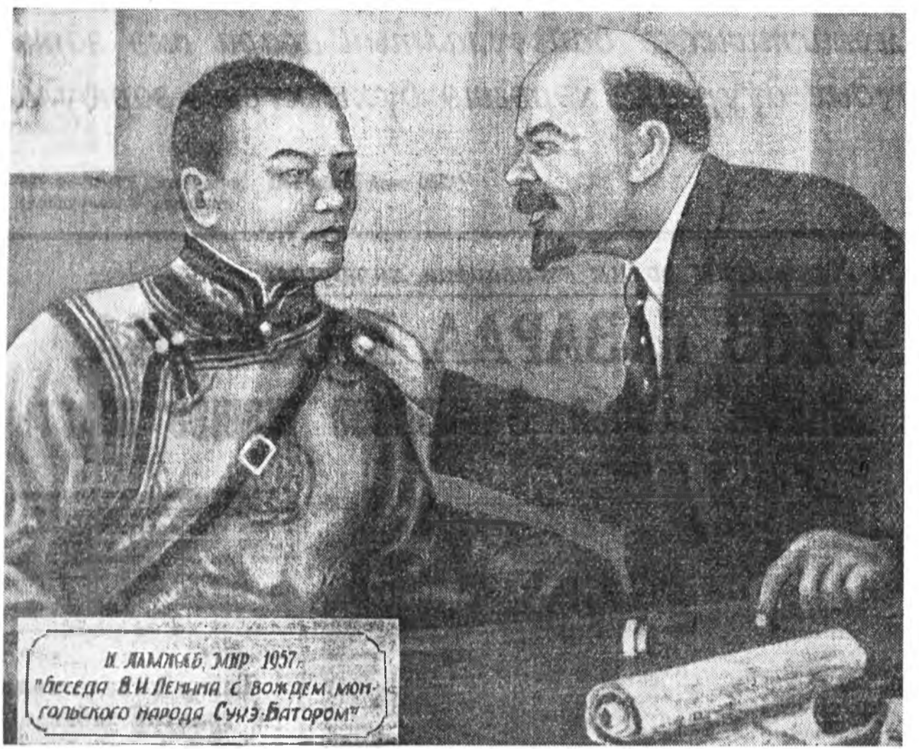
И. ЛЕНИН, МЭР. 1957. "Беседа В.И. Ленина с вождем монгольского народа Сунз-Батором"