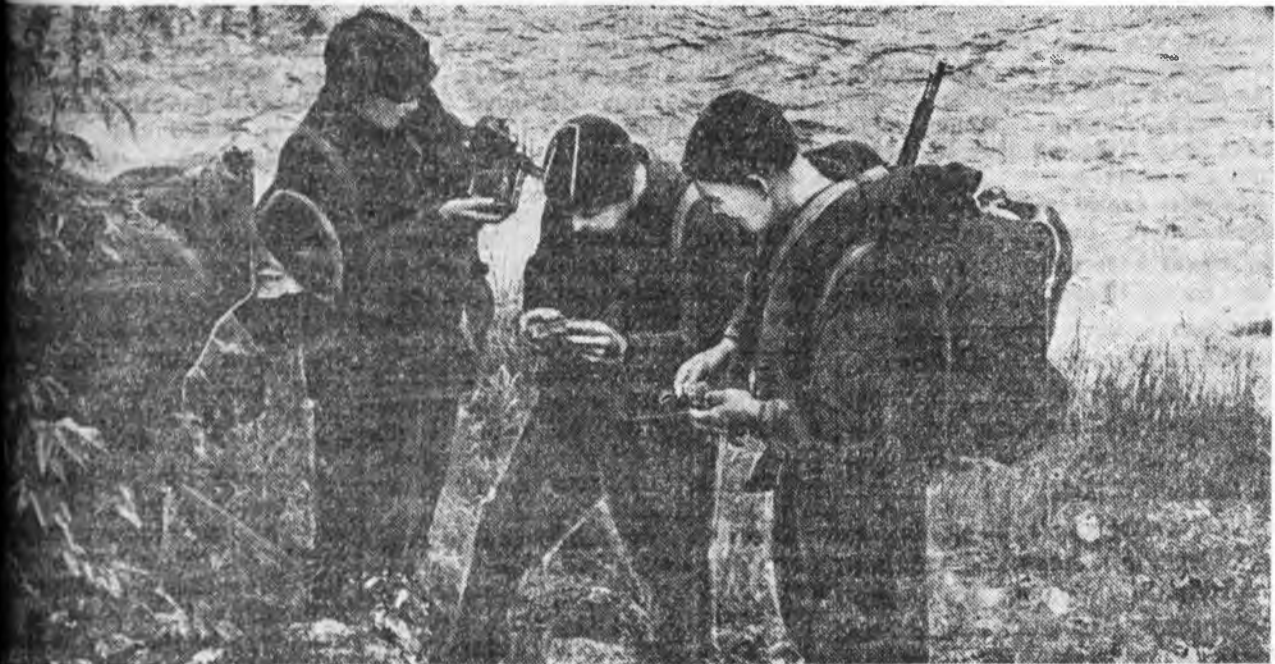
УГА ДЭЭРЭ: геологуд Турка голы эрьдэ.