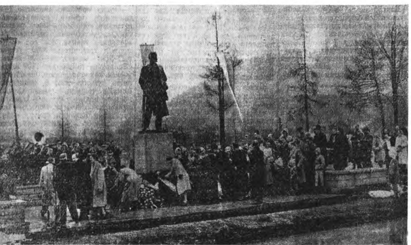
Польшын Арадай Республика. Поронно гэжэ һуурида (Краков шадар) В. И. Ленинэй музей бин юм. Зураг дээрэ: В. И. Ленинэй памятниктай дэргэдэ венк табига байна.