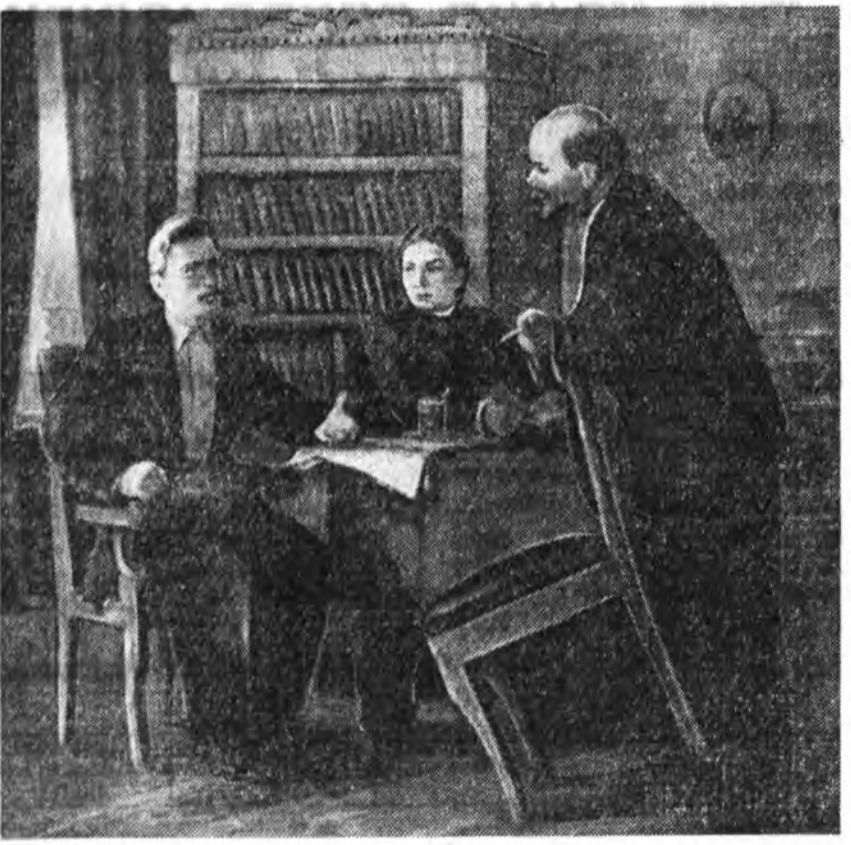
Бурядай арадай уран зурааша А. Окладниковай зураг. Б. Попов буулгаба.