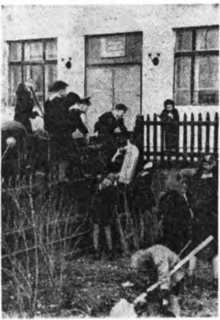
ЗУРАГ ДЭЭРЭ: № 26 һургуулин 3-дахы класс һурагшад һургуулингаа харша олон бөг шорой сэмбэрлэж байна.