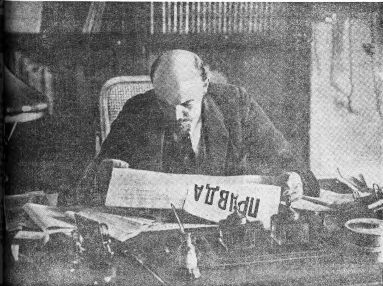
В. И. Ленин Кремльсоохи—хүдэлмэрингөө кабинеттэ. 1918 оной октябрь.

Литература, искусствын талаар Ленинскэ шангууды олгохо ССР Союзай Министруудэй Сөвөдэй дэргэдэхи комитеттэ