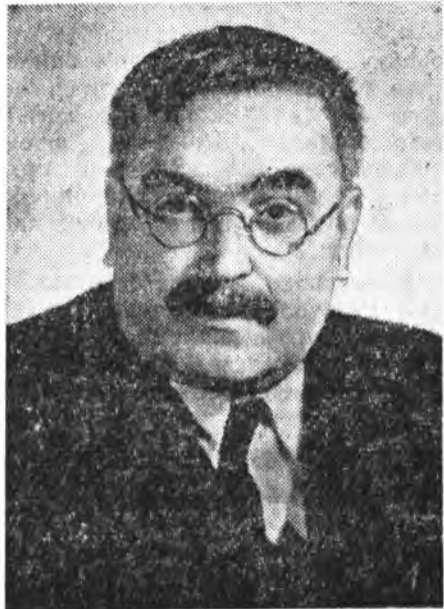
В. А. Фок.