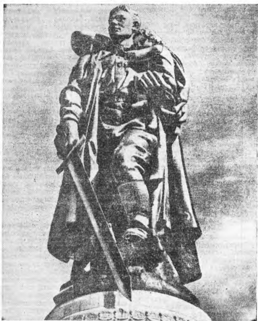
Советскэ Армин сэрэгшэдэй дурасхаалда зорюулжа Берлиндэ табигдаһан памятниктай гол монумент «Совет сэрэгшэ-илагаша». Монументые зоёогшо скульптор Е. В. Вучетич.