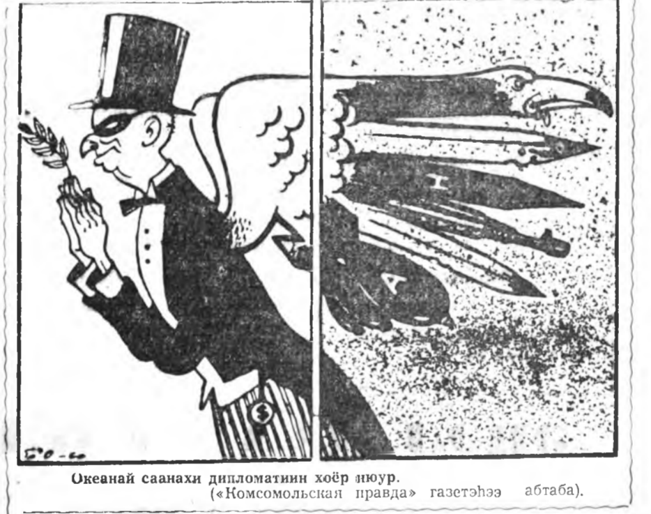
Океанай саанахи дипломатин хоёр инопур. («Комсомольская правда» газетһээ абтаба).