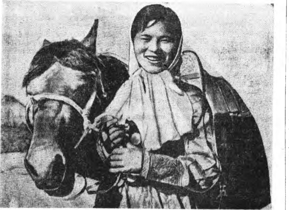
18 наһатай казаг сабаган Бибисара «Красное знамя» гэжэ арадай коммунист түүрүүлэгшэ юм.

раггүйгөөр хосорһон байна. 20 мянган хүн гэр байрагүй болоо. Редакторай орлогшо. С. БАЛЬЖИНИМБАЕВ