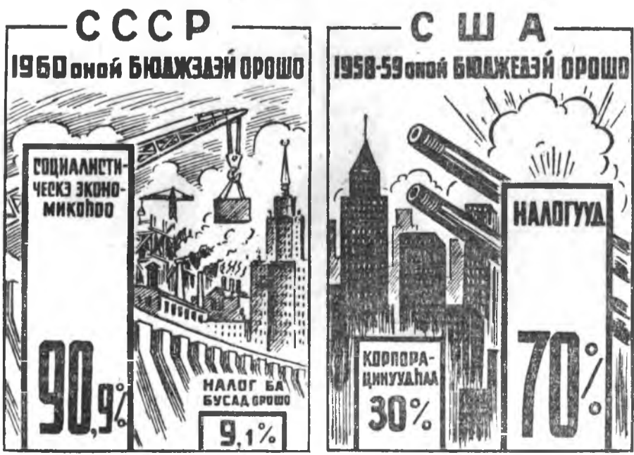
Д. Дамбаевай зураһан диаграмманууд.