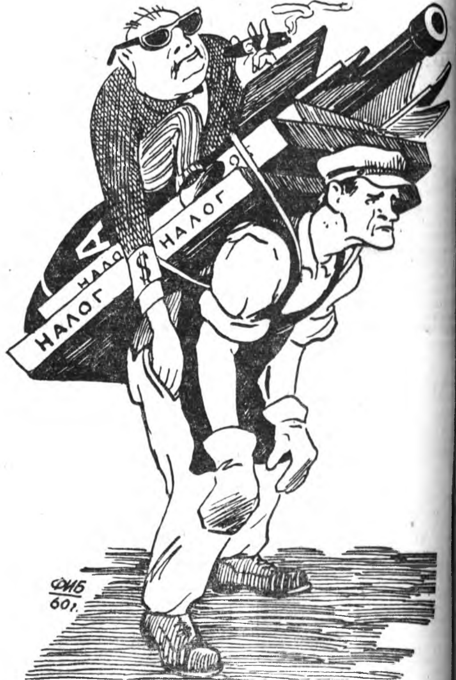
КАПИТАЛАЙ ОРОНУУДА. Ф. Балдаевай зурагуд.

приятинуудта худалмариин үдэр 14—16 час соо үргэлжэлнэ. 1946—1957 онуудта хүн бүхэнэй түлээдэг налог 74 процентээр нэмэһэн байгаа.