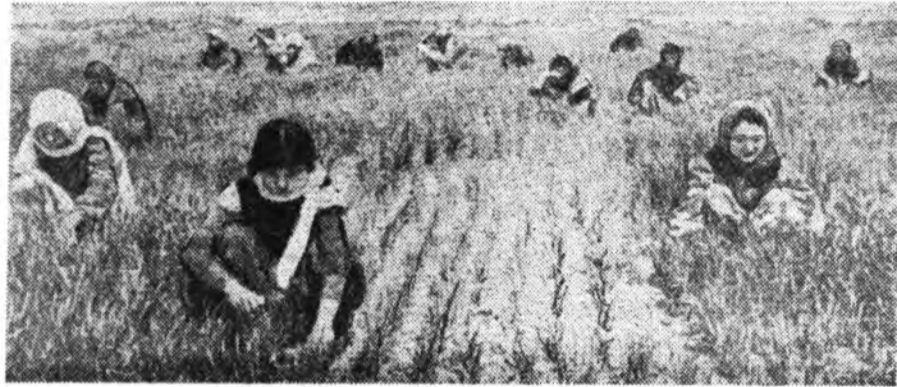
Казагууд хүдөө ажахые хаяхан эрхилжэ эхилбэшэе, шэнинсын найн ургаса абадаг болонхой.

Үбэр Монголой ниислэл — Хүхэ-Хото ургажа үндыжэ байна. (Үргэлжэлэһын хожом гараха)