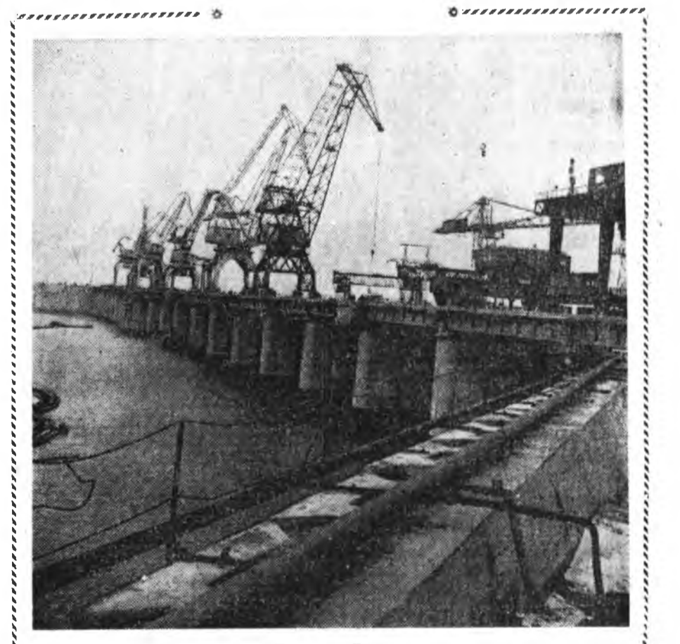
УКАИНЫ ССР. Кременчугска ГЭС-эй түрүүшын 4 агрегат нёдондоо электрын элшэ үгөжэ эхилэ хэн. Мүнөө тэрэнэй табидан, зургаадахи агрегатууд хабараргажа байна. Барилгашад Агууехэ Октябрьнин 43 жэлэй ойн байдэрэй урда тээ—болшоһон хоёр жэлээр урид ГЭС-эе бүхы хүсэн соонь табиха гэжэ шиндээ. Зураг дээрэ: Кременчугска ГЭС-эй барилгын нэгэ участок дээрэ.

Аажан номгон Гааргын ара талада Ханда басаган хатуу дура зоригоо бадаруулжа байдаг. Магад, Гаарга горхон Хандынгаа ерэхэдэ харьялан үрдадаг бэшэ гү? С. Ангабаев. Баргажанай аймаг.