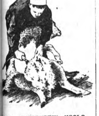
3-ДЭХЭЭ. ГҮЗЭЭНЭЙНЬ НООБО ХАЙШАЛХА

Хо хуулгаһан бээрээ зүүн гарынхоноогоор толгойёе хабшаад, гурдан талын баруун хүлөө багана байгаад, үбсүүннэнь эхилээд дунда хүрэтэр машинкаараа гүзээ баруун талаар доошонь нэгэ удаа ябуулжархиха.