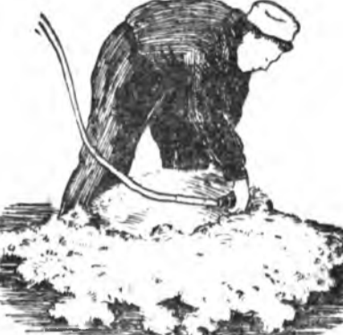
8-ДАХЯА. ЗҮҮН БЭБИЕНЬ ХАЙШАЛХА

Эдэ арга дүршэлые манай республикын колхоз, совхозуудта нэбтэрүүлхэдэ зохистой гэжэ ханагдана.