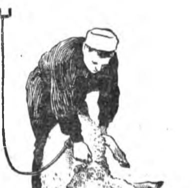
10-ДАХЯА. БАРУУН ТАЛЫЕНЬ ХАЙШАЛХА

Баруун хүлөө хониний хойто хүлүүдэй саагуур табижа, толгойнь барыжа байгаад, нюрганайн нүгөө талаар хоёр удаа утаар ябуулжархиха.