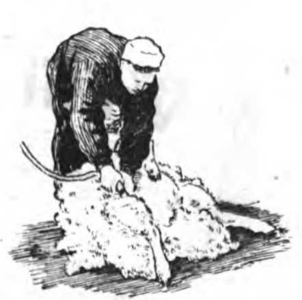
4-ДЭХЭЭ. ХОЙТО ХҮЛНҮҮДЭЙ САМИ ТАЛЫЕ ХАЙШАЛХА

Хо хүдэлгэнгүй хуулгаад баруун талынь бага зэргэ хотинлон түрүүшынхидээл адлаар машинкаараа, гүзээнийнь зүүн захээр хайшалха. Удаань гүзээнийнь баруун тээшэн зүүлжэнь, дээд доошонь хиргаха.