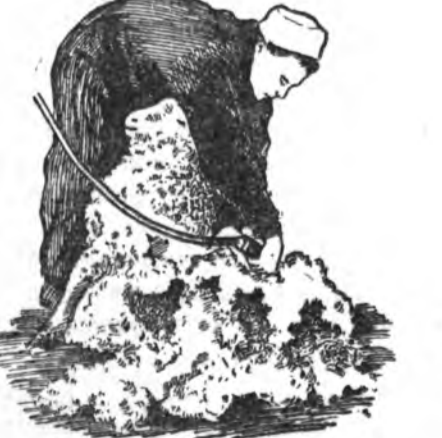
5-ДАХЯА. ЗҮҮН ТАШААГАЙНЬ НООБО ХИРГАХА

Түрүүлэн баруун самине хайшалаад, удаань машинкаараа туруунһаань эхилээд зүүн саминея хиргаха. Хэрэгтэй болоо хаань, хүлэйнь үе дээрэ дараад, тэрэниэ сэхэдхэжэ болохо.