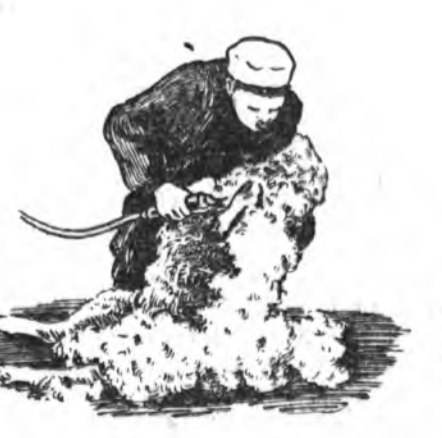
6-ДАХЯА. ХҮЗҮҮНЭЙНЬ НООБО ХАЙШАЛХА

Хониний баруун талын урда хүлөө өөрынгөө баруун булшан доогуураа хээд, хониний зүүн ташааны хайшалха. Тинхэдэ туруунһаань эхилээд, нюрган тээшэн 5—6 дахин машинкаая ябуулжархиха.