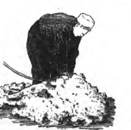
7-ДОХЕО. ЗҮҮН МҮР ТАЛЫНЬ НООБО ХИРГАХА

Зүүн хүлөө хониний зүүн талын хүдэ шахаад, баруун гараараа үргэн дооһоонь барыдаг, хонёо хуулгажархёод, үбдэг дээгүүрээ толгойёе гэдэргэнэ дарад гэхэ. Хүзүүнэйнь нооно хайшалхадаа үбсүүннэнь эхилээд баруун талаарнь машинкаая гурба дахин дээшнэ ябуулаад, зүүн талаарнь нэгэ удаа доошонь ябуулжа.