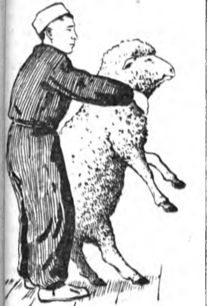
1-ДЭХЭЭ. ХОНЕО БАРИАД, ТАЛХА ГАЗАРТАА БУУЛГАХА

Оренбургын областин колхоз, совхозуудта хони үсхэбэрлэхэ таһамар шэнэ, хонин юумэ харгалжа, тэндэхи хониний ямар аргаар хони хайшалдаг болоһон дүршэл тухай энэ хуудаһанда тусхай корреспондент бэшбэ.