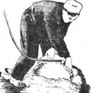
9-ДЭХЭЭ. ЗҮҮН ТАЛЫЕНЬ ХАЙШАЛЖА ДҮҮРГЭХЭ

Хонёо баруун хажуугаарнь зүүн хүл дээгүүрээ буулгаха. Зүүн хүлэйнгөө табижа хониний баруун дала доро хээд, баруун хүлөө хониний хүлүүдэй хоорондуур табижа. Тингээд хониний хүлүүнээ шэлэ хүрэтэрнэ машинкаараа гурба удаа ябуулжа.