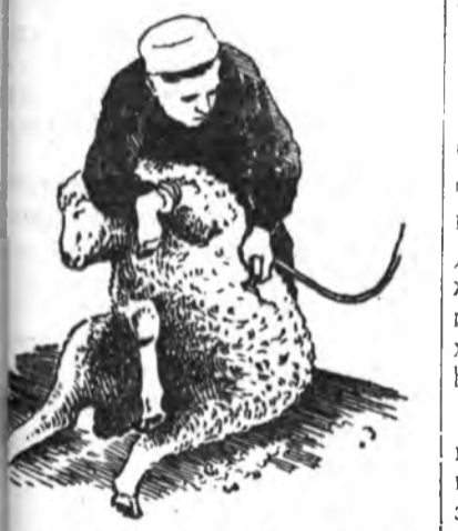
2-ДЭХЭЭ. ГҮЗЭЭНЭЙНЬ НООБО ХАЙШАЛЖА ЭХИЛХЭ

Хо ара талаһаань барыдаг, хоёр галуу хузуунайнь доодо талаһаа дүнгэртэй хонёо, ара тээшэн бодло, сээжэ бэмын 45 градус байгэдэргэнэ сугаруулжа, хүдэлжэ асарна. Хониний тэршэлхээс аман, хурьгаараа үргэн доронь дараа.