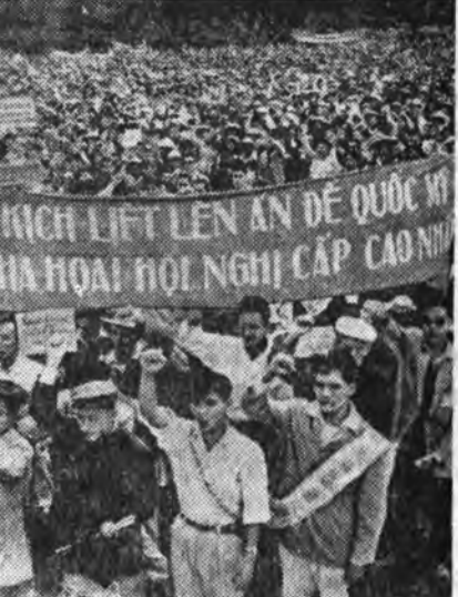
Дээдэ тушаалтадай зүбөө буруутуулан американска империалистуудай ээрхэг ашгануудта эсэргүү митингүүд Ханойдо болоо. Митингдэ хабаадагшад Урда Вьетнамаа американска империалистуудые арилгаха, холодуула эрхэтэ табья. Зураг дээрэ: демонстрацида хабаадагшадай жагсаал.

Киси болон тэрэнэй дүтын туһамаршад эзэнэйнгэе урда бохирон унаһан богоолой ааша гаргахынгаа хажуугаар, япон-американска «Аюулгүйн договорт» эсэргүү япон арадай тэмсэлэй часнаа час бүри хүсэ орожо байһаниие дарахын тула эгээл шэрүүн хэмжээнүүдые абахааа оролодо. Һүүлэй хоёр үдэрэй туршдаа правительствода эсэргүү жагсааднуудта хабаадалсаһан 175 хүниие тэдэнэй харуул, хиналгада абаа. Правительство студентнэрий элдэб буналгаа, хүдлөөнэй илбарай байхадань дараха полициин хажуул тагнуул университетүүдтэ табиха ханалтай гэжэ зонхилхы либеральна демократическа партиин толгойлогшодой нэгэн Синода мэдүүлээ.