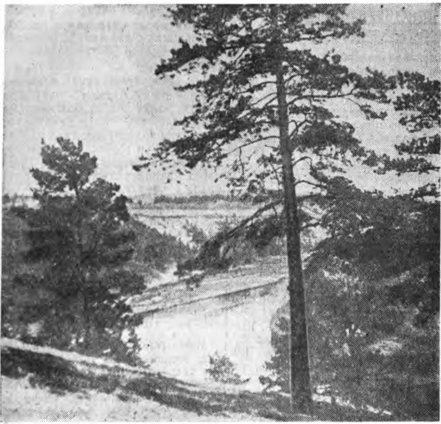
Сэлгэхэн Сэлэнгийн эрьдээ...