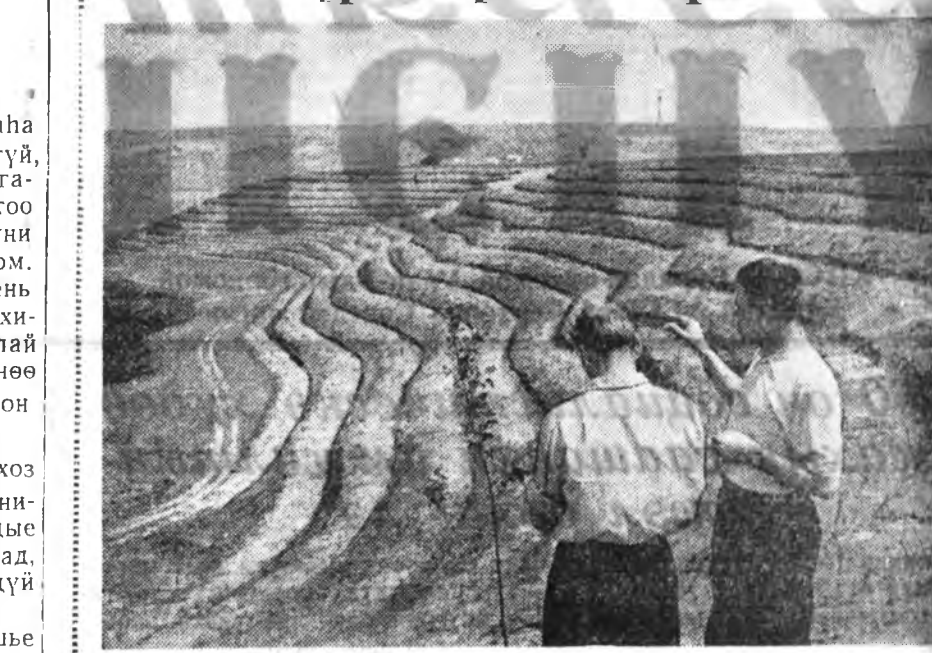
Молдавин ССР. Котовско районой Ленинэй нэрэмжэтэ колхозой гэгшүүд хада, ташалан газарнуудыс элдүүлжэ, 370 гектар газарта...